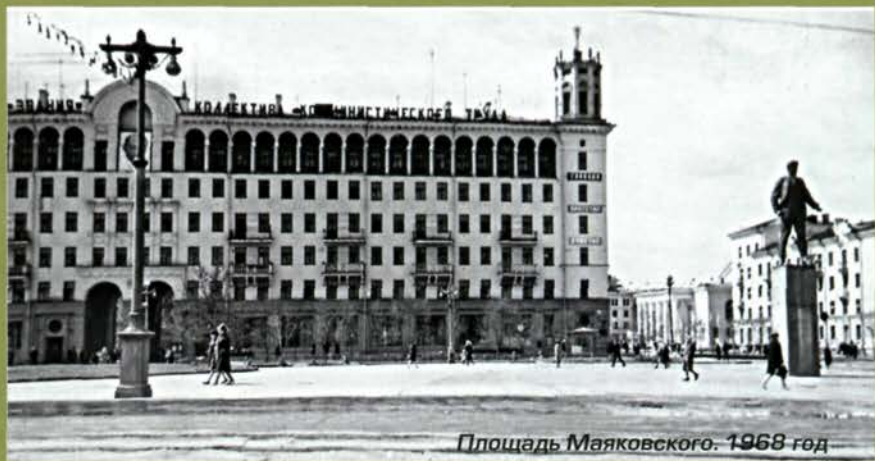
Площадь Маяковского. 1968 год

Свои истории рождения бывают не только у людей, но и у памятников, рукотворной и нерукотворной работы. И судьбы их проходят невероятные перипетии, как правило неожиданные и трудные. Как и у тех, кому они посвящены. Речь пойдет о памятнике В.В. Маяковскому, установленном в нашем городе 1 ноября 1967 года. С тех пор минуло 55 лет. Словом, есть повод вспомнить.