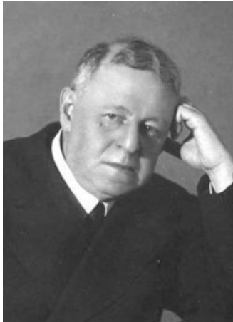
Евгений Викторович Тарле