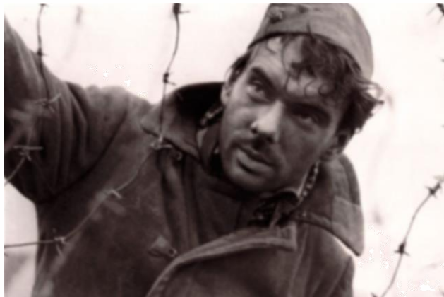
Алексей Баталов в роли Бориса Бороздина

1958 МКФ в Каннах (Гран-при «Золотая пальмовая ветвь» - Михаил Калатозов)