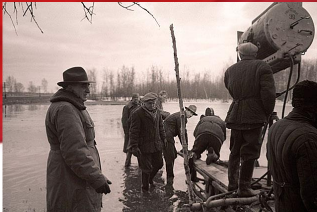
Съёмки фильма «Летят журавли», 1957 год