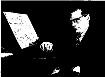
Дмитрий Дмитриевич Шостакович

В 1923-м Дмитрий Шостакович закончил консерваторию по классу фортепиано, и отложив на время своё композиторское образование, так как семья на тот момент нуждалась в его помощи, устроился тапёром в кинотеатр «Светлая Лента», где и иллюстрировал, по его выражению, « время страстей человеческих ». Композитору не особенно повезло. За два месяца работы в этой «должности», он всего лишь один раз по-