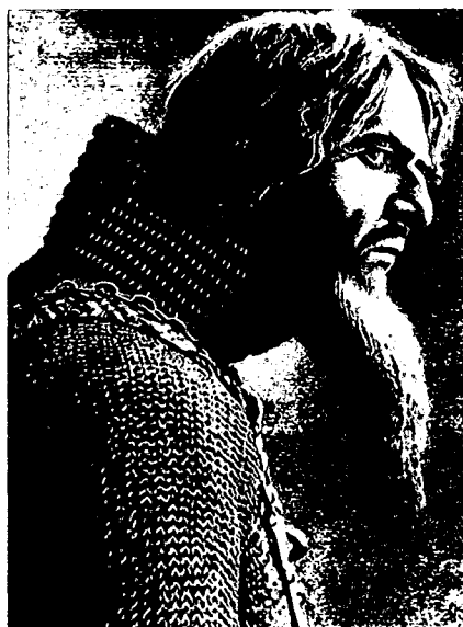
Фёдор Шаляпин в роли Ивана Грозного, 1915 г.

Позже появились фильмы «Мёртвые души», «Бахчисарайский фонтан», «Русалка», «Вий». Выбор классической литературы не всегда гарантировал успех картины. Не всегда речь шла о чистой экранизации — снимали и по мотивам того или иного литературного произведения, что требовало нового прочтения, полёта мысли, творческой фантазии, интерпретации. Не только лучшие образцы отечественной литературы становились основой фильма, случалось, что тому «виной» становились и иные простенькие сюжеты, относящиеся к разряду бульварного чтива. Впрочем, это вполне объяснимо: зритель был разный, в большинстве малообразованный, а то и вовсе безграмотный.