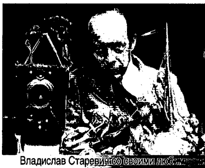
Владислав Старевич со своими марионетками

От чистой анимации Старевич перешёл к сложным комбинированным съёмкам, где вместе с куклами снимались и настоящие актёры. В частности, знаменитый актёр немого кино Иван Мозжухин сыграл чёрта в фильме «Ночь перед рождеством» (1913). После революции 1917 г. Старевич, как и многие его коллеги, покинул Россию, эмигрировав сначала в Италию, затем во Францию, где продолжал много трудиться. В 1949 г. за свой первый цветной фильм «Цветок папоротника» он полу-