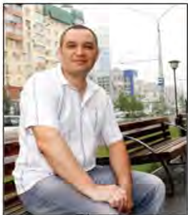
Скульптор Вадим Гусев

Памятник представляет собой фигуру солдата в полный рост в военной форме. Герой-пехотинец в пилотке с винтовкой и обычной скаткой через плечо виден издали: высота чугунной скульптуры с постаментом около 5 метров, вес 17,5 тонны. Надпись на постаменте гласит «Твой подвиг бессмертен». Памятник и постамент выполнены из чугуна. Скульптор Вадим Гусев. Отлит монумент в ООО "Ремонтно-механический завод" ЗСМК. Формовщик С. Никоненко.