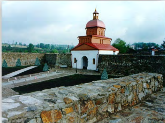
Кузнецкая крепость, 2012 г.