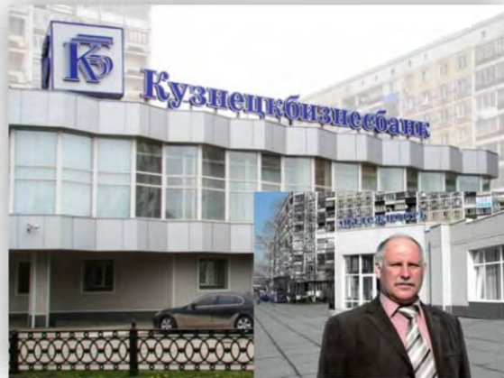
Кузнецкбизнесбанк, 2011 г.