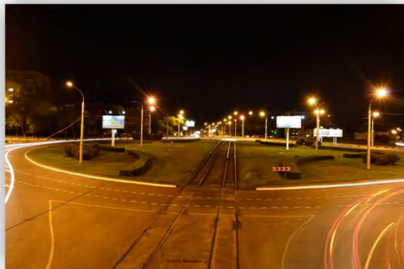
“Кольцо” на Советской площади, 2011 г.