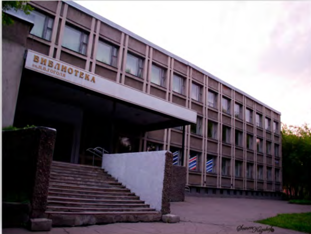
Централизованная библиотечная система им.Н.В.Гоголя, 2011 г.

Ист.: Рядом с великими // Кузнецкий рабочий. - 2002. - 24 января. - С. 1.