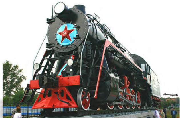
Монумент железнодорожной славы (паровоз), 2011 г.