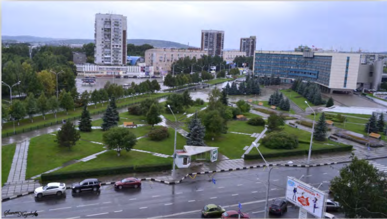
Администрация города, 2012 г.