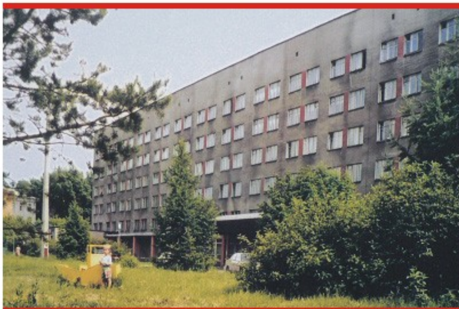
Детская больница №4

Люди в белых халатах - особенный народ, благородная профессия, и те, кто ее выбрал, по-другому жить и работать уже не могут. С годами понимают, что надеяться, как ни печально, нужно только на себя, государству пока как-то не до медицины. И вспоминают о медиках лишь в дни профессионального праздника.