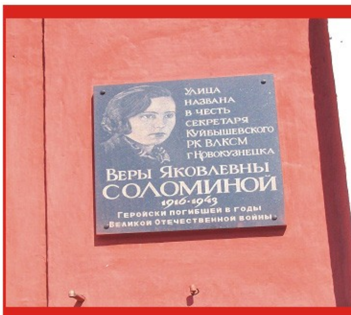
Мемориальная доска (Лицей №47)

...Вы идете по улице Веры Соломиной. Приостановитесь на миг, поклонитесь памяти воспитанницы Ленинского комсомола, героически погибшей за Родину, за нашу свободу, за нашу светлую жизнь.