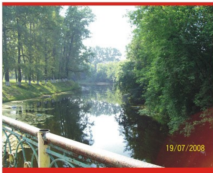
Пруд у ДК им. Дзержинского