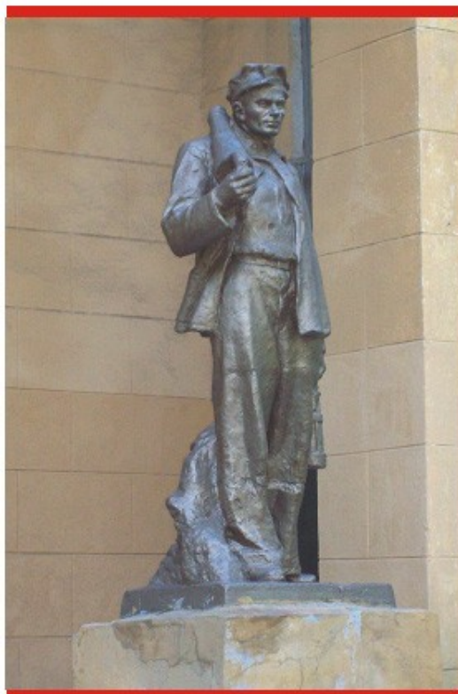
Скульптура у ДК им. Дзержинского

Такие вот замечательные «мемуары». Напоминаем, что ждем ваших писем и фотографий Параллельно с нами сбор материалов ведет и библиотека имени Гоголя. Фотографии заносятся в электронный банк данных по истории города. Причем и фотографии частного порядка - ведь они тоже несут печать времени: очень интересно, как одевались наши мамы и папы, дедушки и бабушки, как выглядели улицы города Обращайтесь к нам, и в Гоголевку. Ждем.