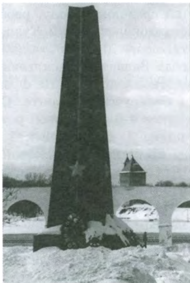
Монумент в Новгороде

16. Улицы их имени: Слава героям-коммунистам // Металлург. - 1999. - 3 февр.