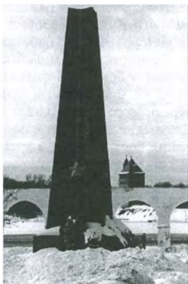
Монумент в Новгороде

15. Рощин И. Коммунисты, вперед! / И. Рощин // Герои Советского Союза. - М., 1982. - Кн. 6. - С.5-8.