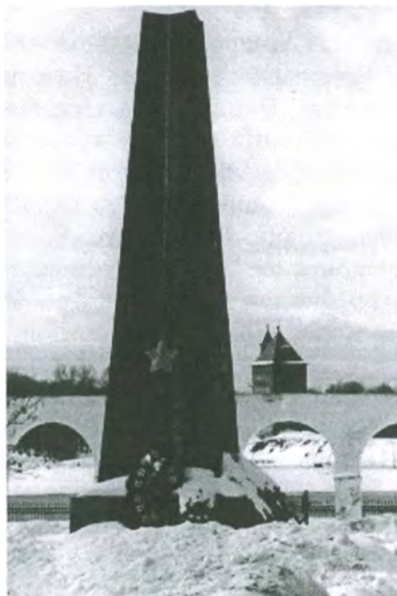
Монумент в г. Новгороде