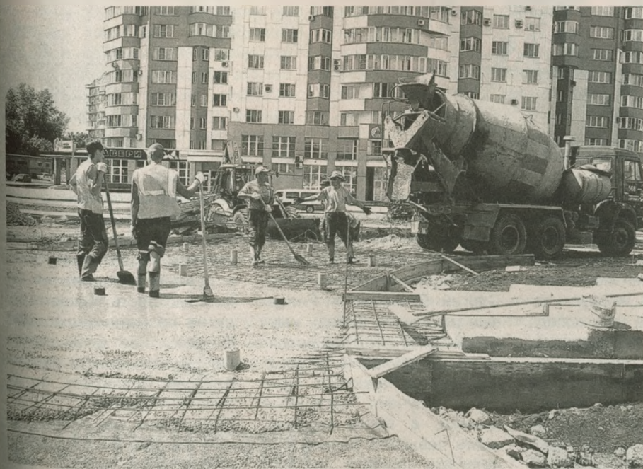
Строители бетонируют площадку возле памятника

ший проверить, как идет строительство. – Почти готовы тротуарные дорожки, ступени к постаменту, привезена земля для газонов и клумб, выполнены бетонные площадки для фонарных столбов. Осветительные приборы приобретены, скоро приступим к их монтажу. Памятник Николаю Спиридоновичу уже изготовлен, как только будет готова площадка, приступим к установке. Новый сквер планируется открыть ко дню города.