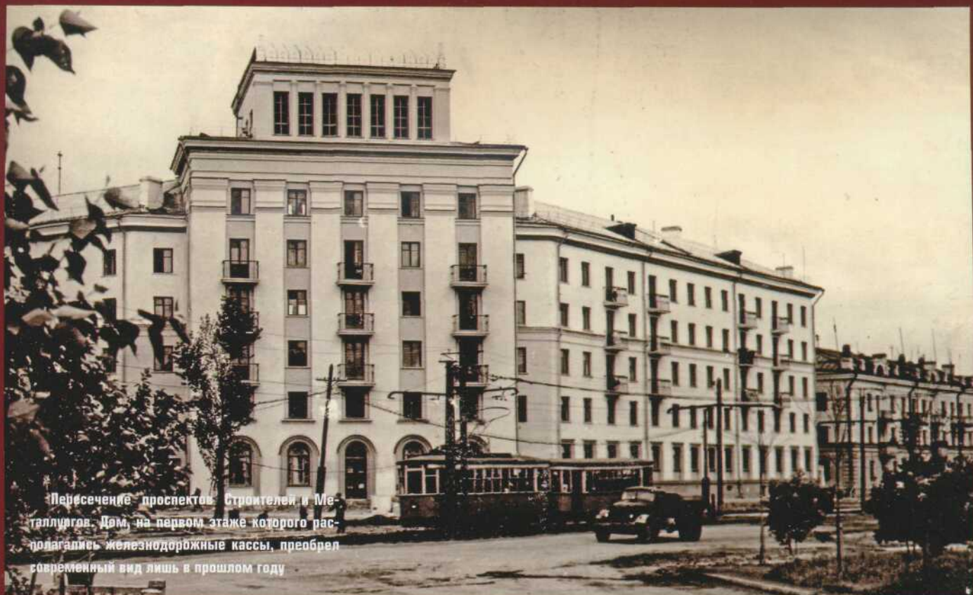
Пересечение проспектов Строителей и Металлургов. Дом, на первом этаже которого располагались железнодорожные кассы, преобрел современный вид лишь в прошлом году

лургов, Курако, ул. Кутузова), где еще недавно лепились одна к другой избушки времен Кузнецкстроя. На главных улицах фасады домов облицовывались железобетонной плиткой, что позволило вести строительные работы круглый год без использования трудоемкой наружной штукатурки.