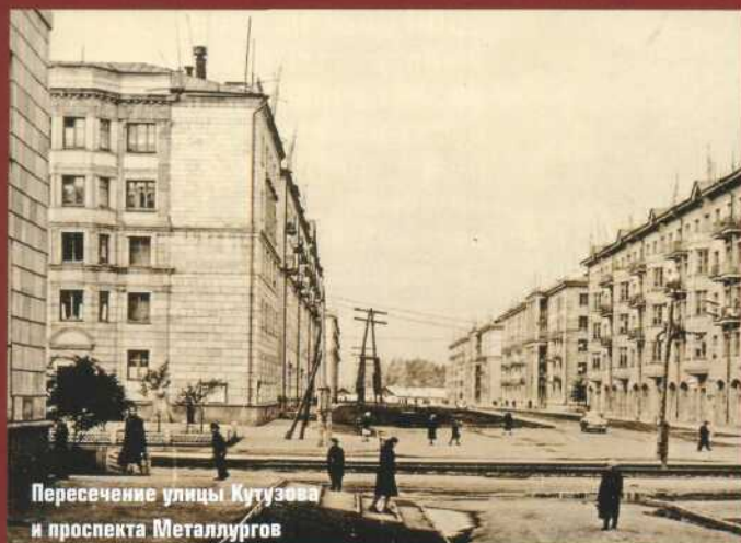
Пересечение улицы Кутузова и проспекта Metallургов

В 1950–1954 годах идет застройка центрального участка проспекта Metallургов (от