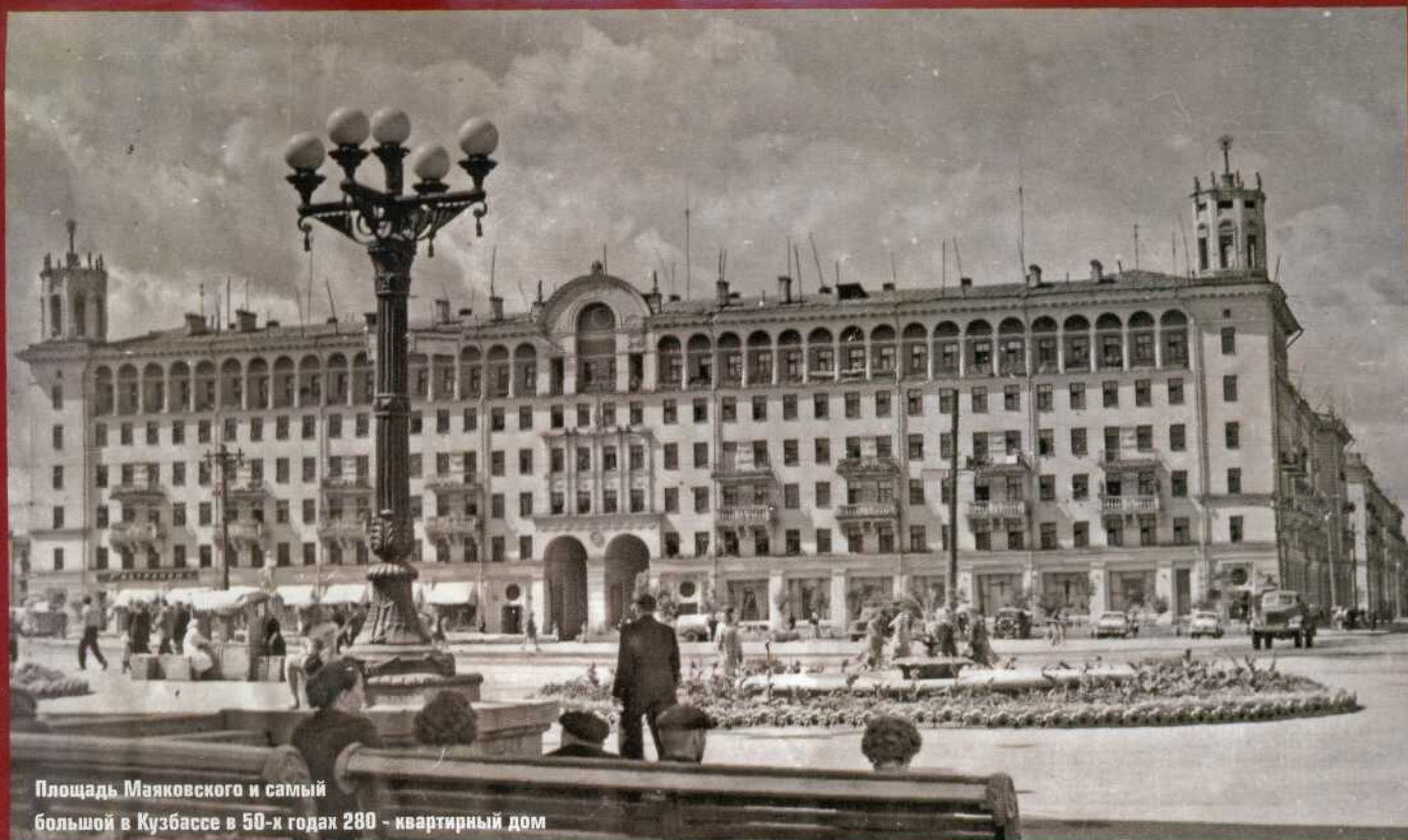
Площадь Маяковского и самый большой в Кузбассе в 50-х годах 280 - квартирный дом