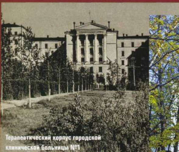
Терапевтический корпус городской клинической больницы №1