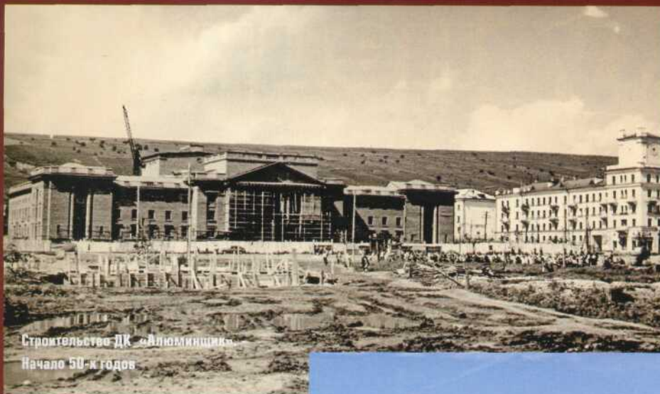
Строительство ДК «Алюминийский» Начало 50-х годов

Молотова. Здесь были построены два четырехэтажных угловых дома и Клуб строителей по типовому проекту.