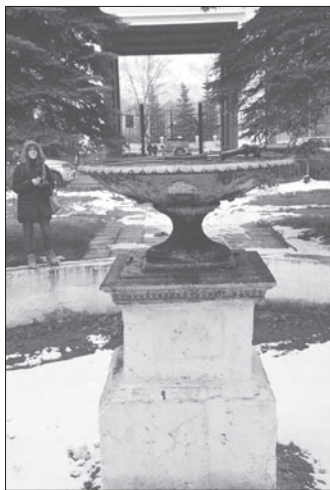
Молчаливый фонтан во дворе дома на Металлургов, 25