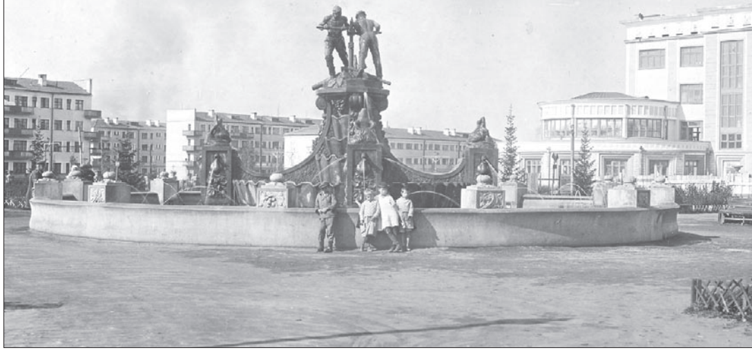
Исчезнувшая скульптурная группа “Бурильщики” в Саду металлургов