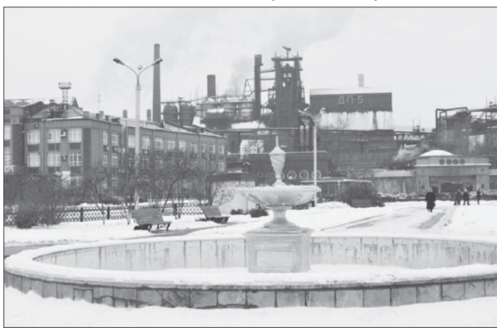
За этим фонтаном в сквере у КМК стоял памятник Сталину

лина - фонтан пришёл в такое состояние, что встал вопрос о его полной замене. Этот вопрос решили положительно, в том плане, что оригинальное творение известного скульптора без лишних сантиментов снесли “до основания”. Правда, пытались сделать гипсовые формы, чтобы заново отлить лягушек в чугуне, но времена гамулиных, как оказалось, прошли безвозвратно. Из этой затеи ничего не вышло, но родился новый фонтан, в целом, неплохой, но, что называется, “без изюминки”: глазу зацепиться особо не за что.