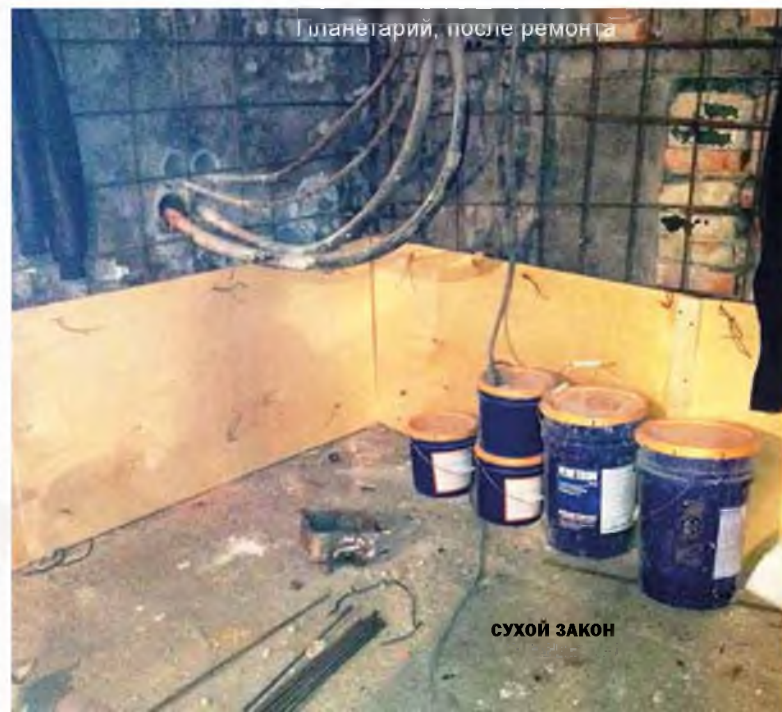
Планетарий, после ремонта