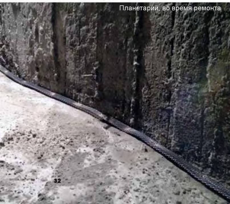
Планетарий, во время ремонта

В 2014 году в рамках программы подготовки к празднованию в Новокузнецке Дня шахтера было заменено покрытие купола, выполнены работы по ремонту внутренних помещений, фасада и витражей, заменено кровельное покрытие, благоустроена прилегающая территория. Конечно, без Пенетрона здесь тоже не обошлось – гидроизоляция стен заглубленных технических помещений была выполнена изнутри материалом «Пенетрон», для гидроизоляции пола в бетонную смесь добавляли «Пенетрон Адмикс», швы герметизировали гидроизоляционным жгутом «Пене-