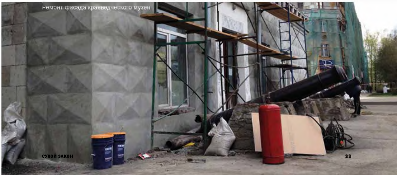
Ремонт фасада краеведческого музея

После капитального ремонта в Кузбассе открылся