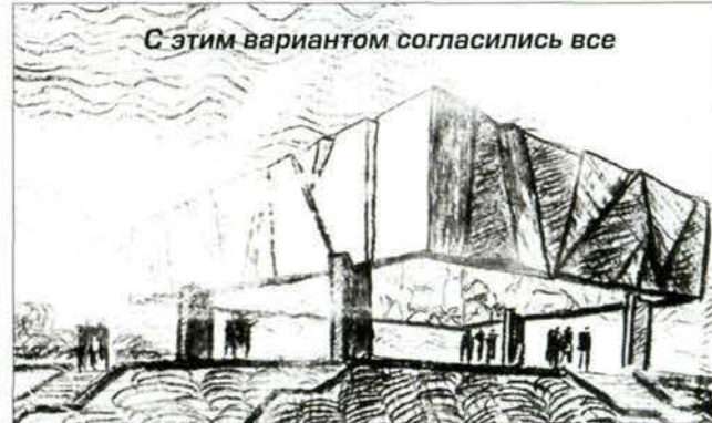
С этим вариантом согласились все