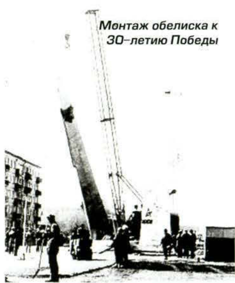
Монтаж обелиска к 30-летию Победы

и ничто не будет напоминать об объекте, стройке, которая стала частью нашей судьбы – архитекторов, скульпторов, строителей, организаторов, заказчиков стройки – УКС КМК. Ведь это часть нашей работы, работы на благо нашего любимого города.