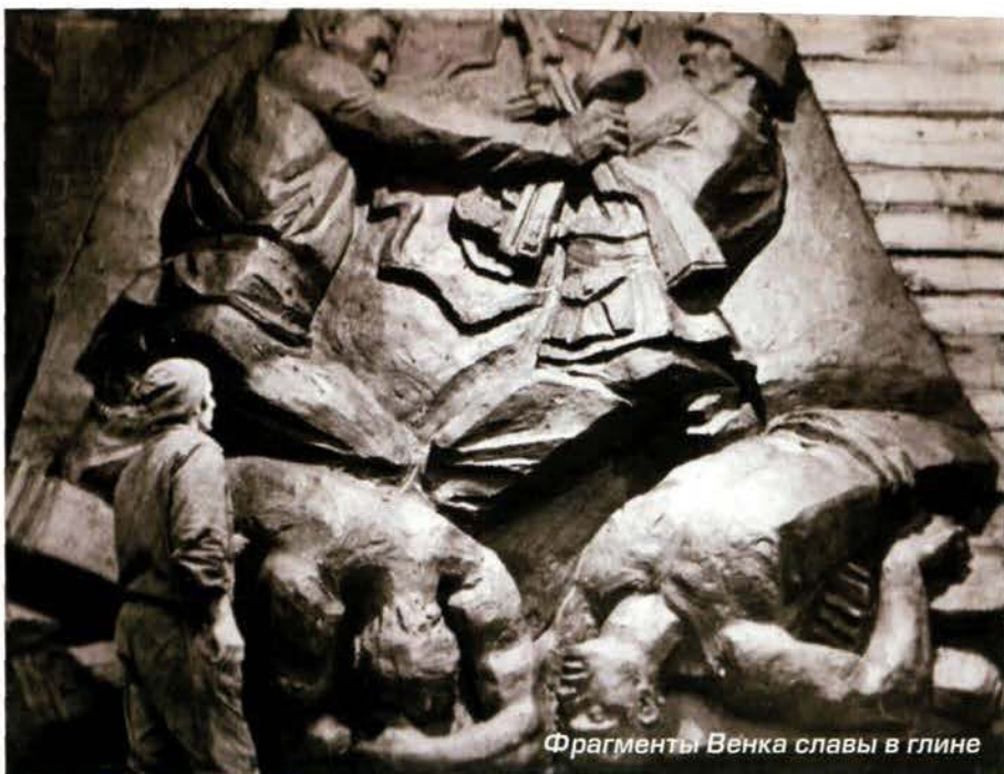
Фрагменты Венка славы в глине

Скульптурная композиция была сложна. Мы по сути создали новую, ранее не