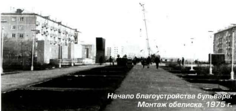
Начало благоустройства бульвара. Монтаж обелиска. 1975 г.