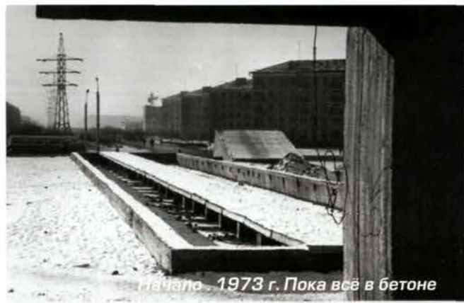
Начало. 1973 г. Пока всё в бетоне

льон «Вечный венок» (иногда его называют так) покрыли брезентовым тентом, топили внутри, сваривали швы, зачищали и тонировали. Было сложно, неудобно, сыро, но времени оставалось в обрез.