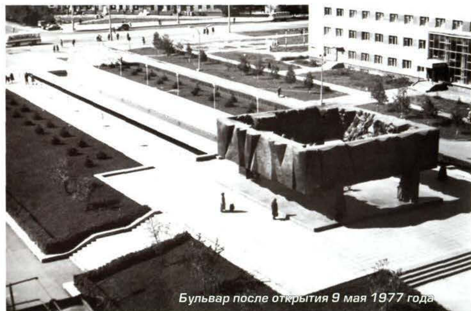
Бульвар после открытия 9 мая 1977 года