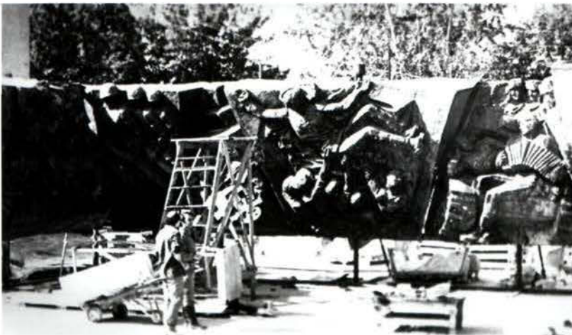
Стыковка элементов Венка славы во дворе скульптурной фабрики. Г. Калуга. 1975 г.