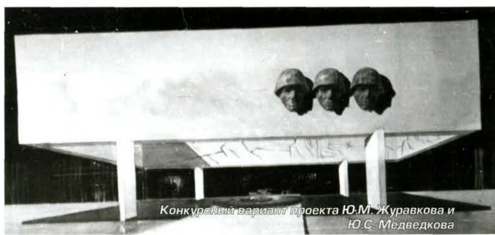
Конкурсный вариант проекта Ю.М. Журавкова и Ю.С. Медведкова

Надо сказать, что бригада, которая прибыла вместе со скульпторами из Калуги, уже три месяца монтировала рельефы, зачищала, тонировала поверхности, и все это в жуткие морозы, которые сменялись относительными оттепелями. Весь пави-