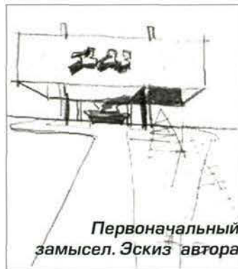
Первоначальный замысел. Эскиз автора