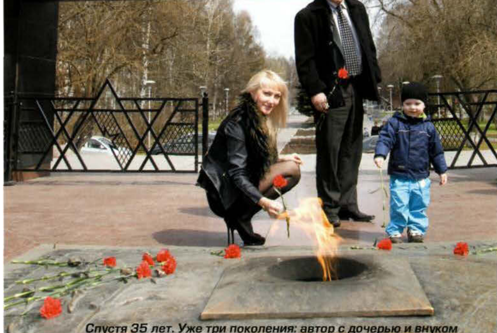
Спустя 35 лет. Уже три поколения: автор с дочерью и внуком