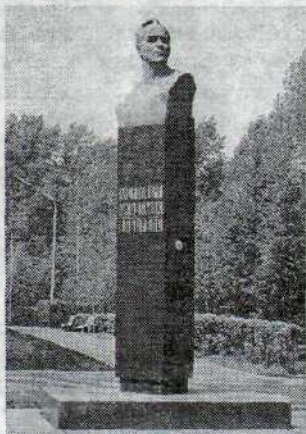
Бюст металлурга, академика И. П. Бардина. г. Новокузнецк, пр. Металлургов

букв: «Здесь работал в 1929-1937 гг. главным инженером строительства и эксплуатации Кузнецкого металлургического комбината академик Иван Павлович Бардин».