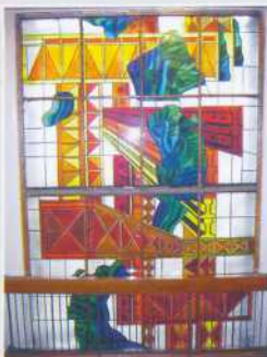
▲ Витраж главной лестницы