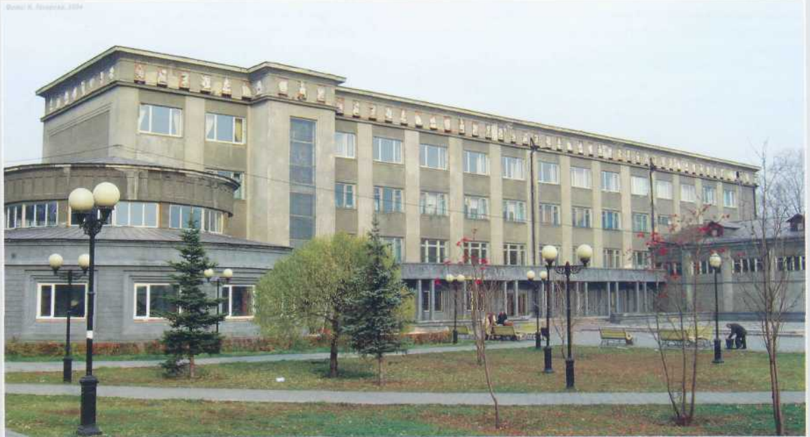
▲ Е. Я. Уманский, К. Я. Лихер. Дворец культуры и техники КМК, 1936