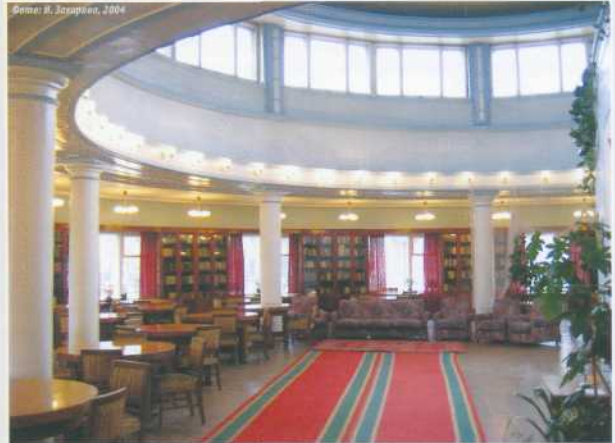
▲ ▼ Интерьер читального зала библиотеки (до реконструкции)