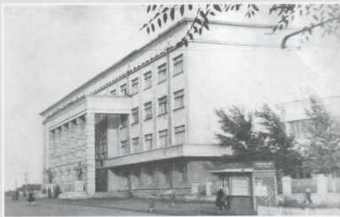
▲ Фото 1950-х годов