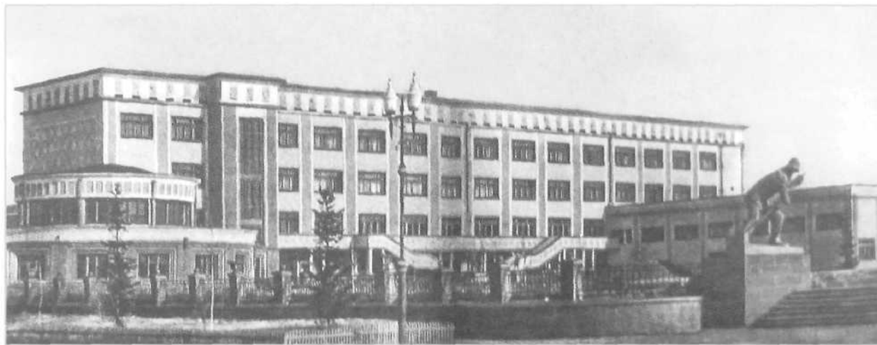
▲ Дворец культуры металлургов в Сталинске. 1936. Вид со стороны Сада металлургов

До настоящего времени Дворец культуры и техники КМК используется по первоначальному назначению. Часть первого этажа занята торговыми и офисными помещениями.