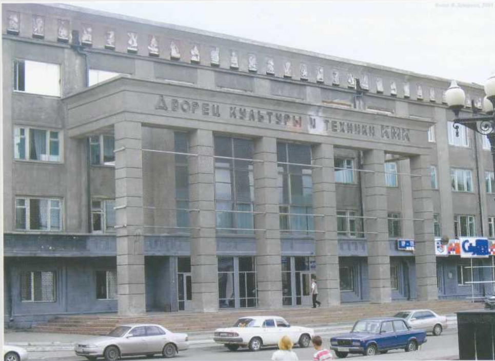
▲ Портик главного фасада