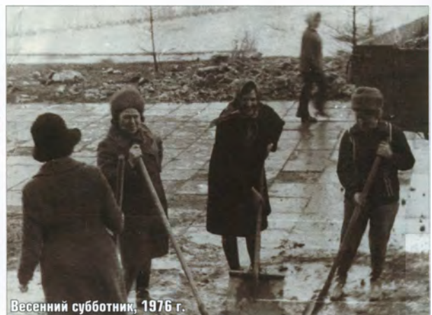
Весенний субботник, 1976 г.