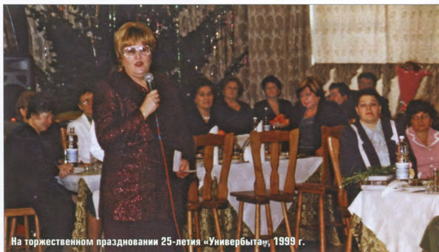
На торжественном праздновании 25-летия «Универбыта», 1999 г.