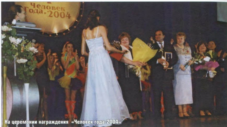
На церемонии награждения «Человек года-2004»

вой договор, в котором регламентирован порядок поощрений членов коллектива, вписаны льготы, условия награждения.