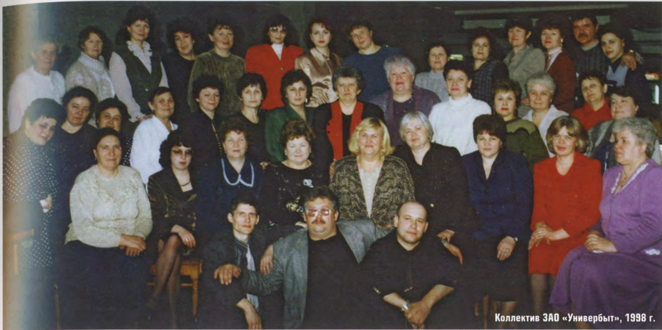
Коллектив ЗАО «Универбыт», 1993 г.

взгляд, честнее жилось, люди знали, где защиту найти, кому, если что случится, пожаловаться. Что делалось «в верхах» — это на их совести, а мы работали ради людей и для людей.