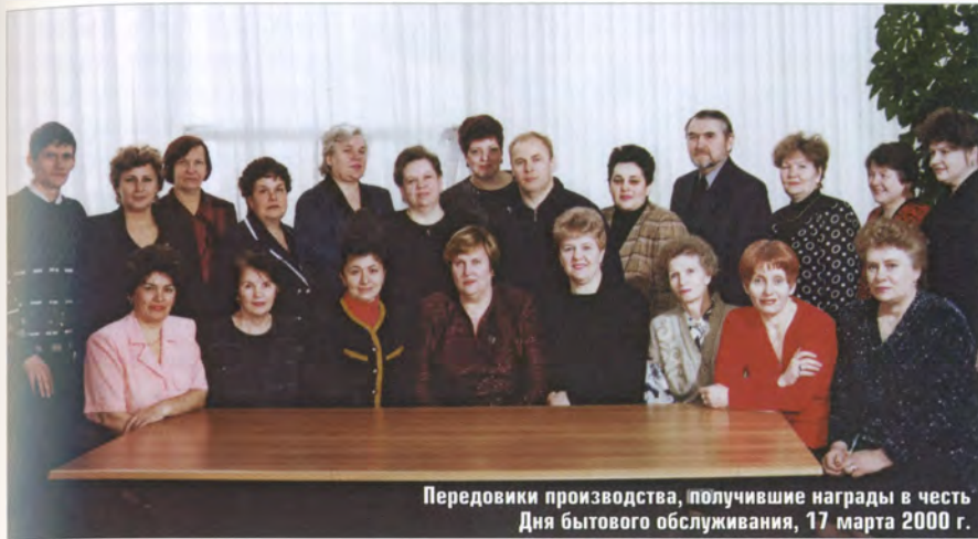
Передовики производства, получившие награды в честь Дня бытового обслуживания, 17 марта 2000 г.

— среднеспециальное. Управляет всеми этими структурами Совет директоров из 7 человек. Все женщины, что и закономерно: это служба быта, а в быту принято, чтобы у руля стояли женщины.