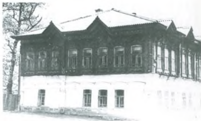
Дом купца Фонарева. Фото 1956 и 1980-х годов

ника колчаковской реакции и как вычищенного при чистке соваппарата...»