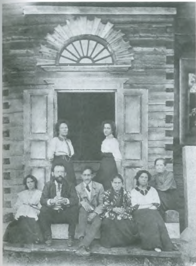
Красимовичи. Начало XX века