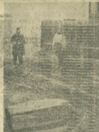
«Камень Талдыкина» в 20-х годах (редкая фотография). Сейчас плита перенесена немного в сторону, вокруг нее сделана ограда.