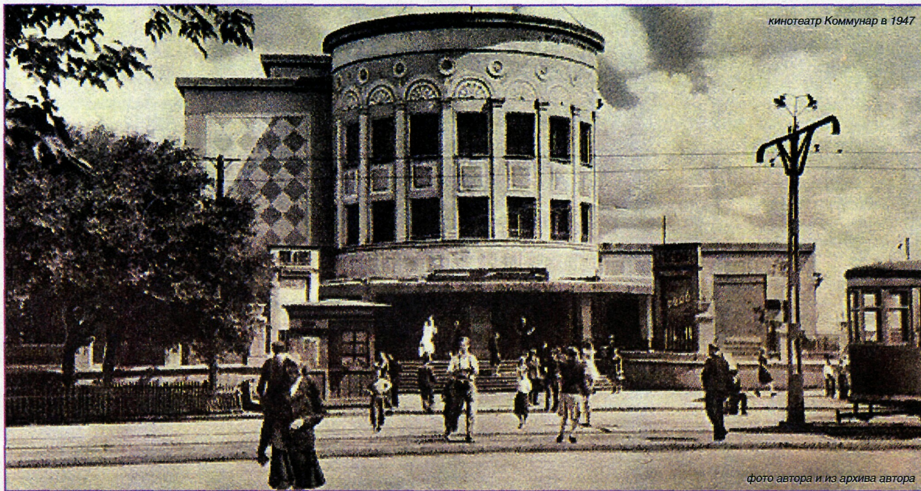
кинотеатр Коммунар в 1947