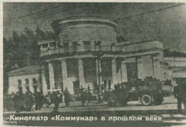
Кинотеатр «Коммунар» в прошлом веке