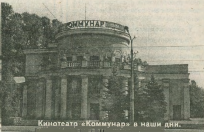
Кинотеатр «Коммунар» в наши дни.