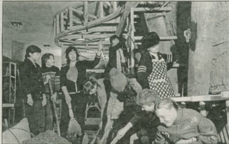
На субботнике – учащиеся школы №44

Р. С. 20 мая в 16.30 на площади Побед у Вечного огня состоится митинг, посвященный 20-летию Мемориального музея боевой и трудовой славы кузнецких металлургов.