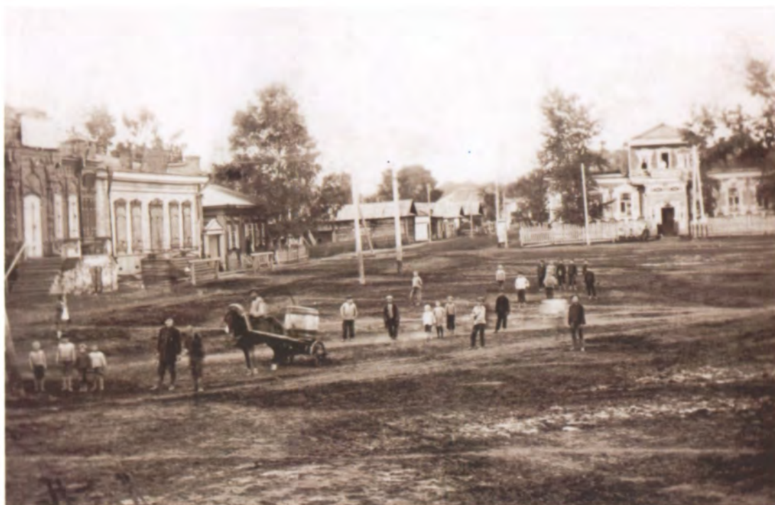
Рис. 4.29. Базарная площадь. На ней располагались магазины купцов Л.Н. Емельянова, С.Е. Шукшина, М.М. Окулова, А.Е. Фонарева и других. Фото 1920-х гг. Из фондов Новокузнецкого краеведческого музея