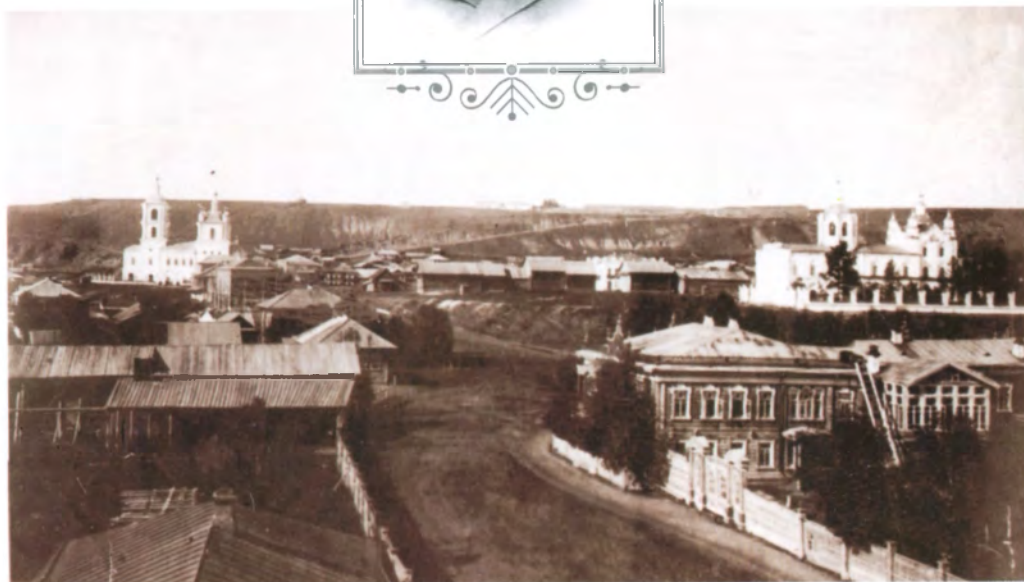
Рис. 4.31. Вид г. Кузнецка, справа усадьба купца С. Попова. Фото 1909 г.