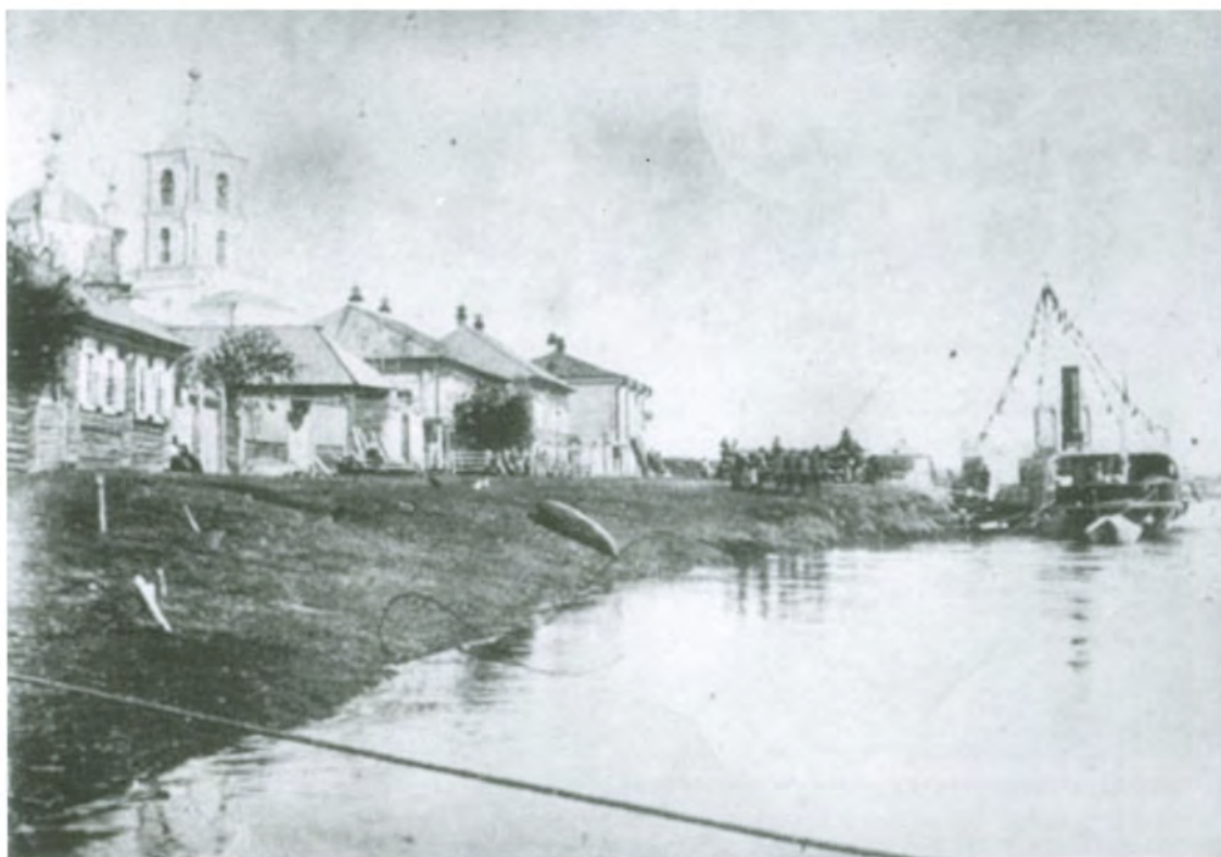
Рис. 4.19. Вид Набережной улицы. Справа – Преображенский собор. Фото начала XX в.