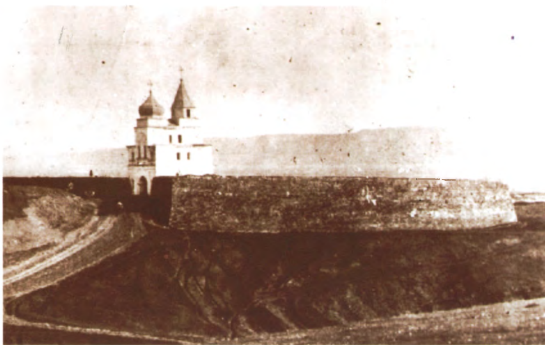
Рис. 4.4. Общий вид Кузнецкой крепости. Фото начала XX в.