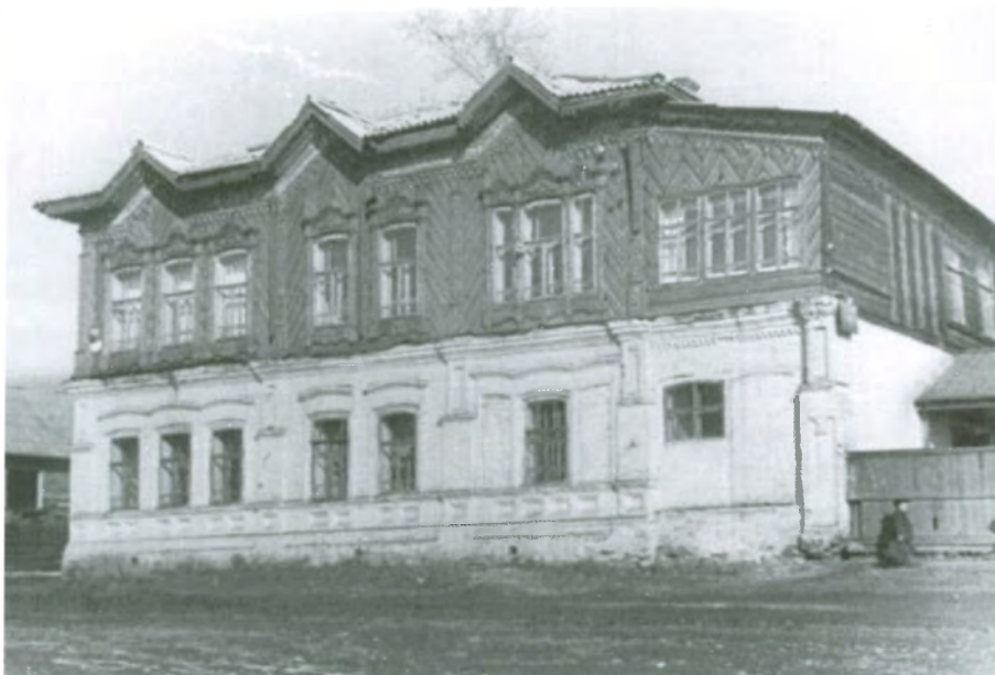
Рис. 4.37. Жилой дом купца А.Е. Фонарева. Фото начала XX в.