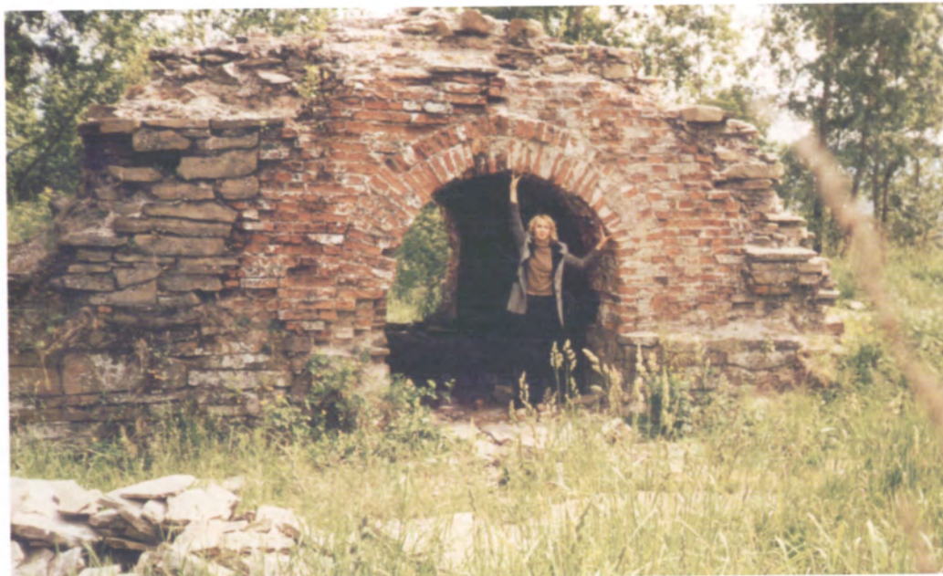
Рис. 4.10. Сортия Кузнецкой крепости до реконструкции. Фото П.П. Зыбайло, 1998 г.