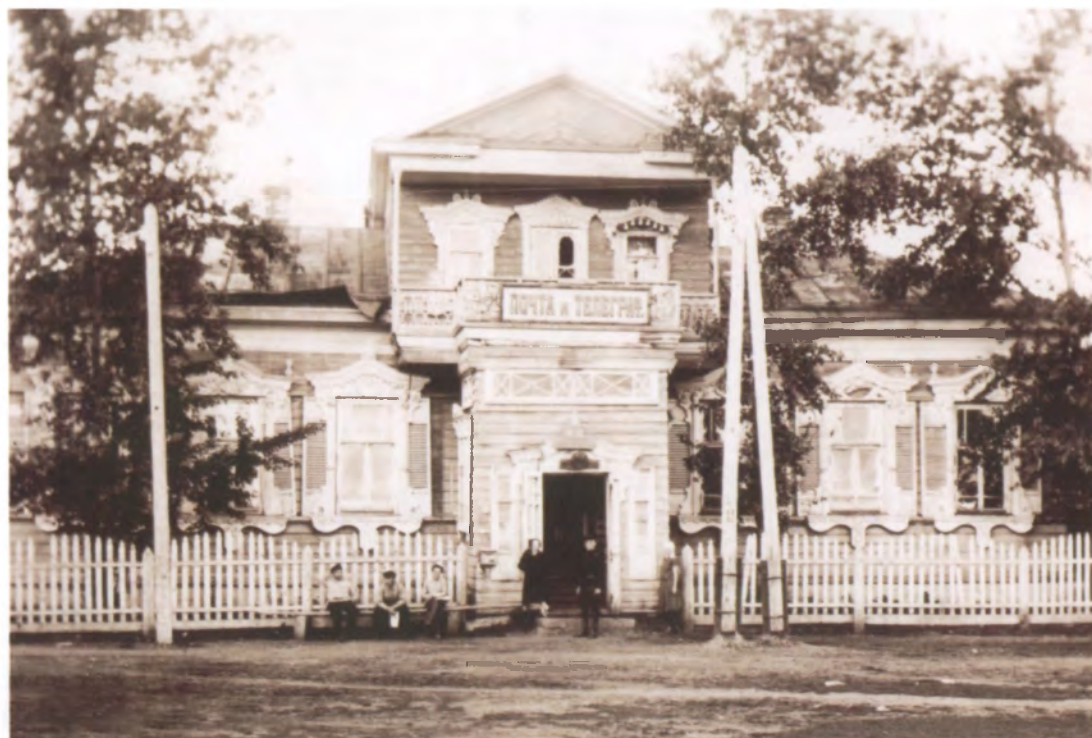
Рис. 4.30. Бывший дом купца М.М. Окулова. Фото 1920-х гг.