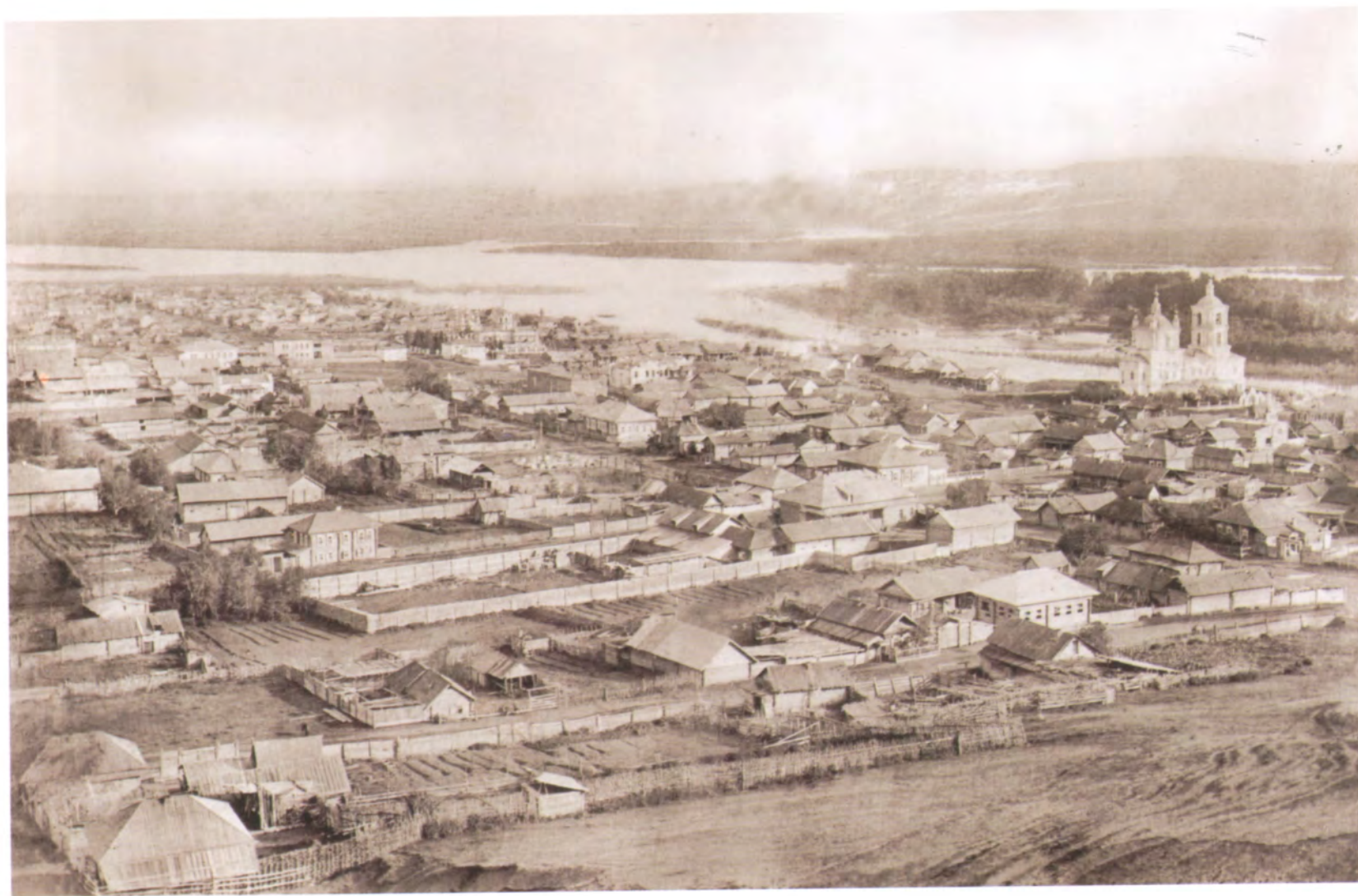
Рис. 4.28. Панорама г. Кузнецка. Фото начала XX в.