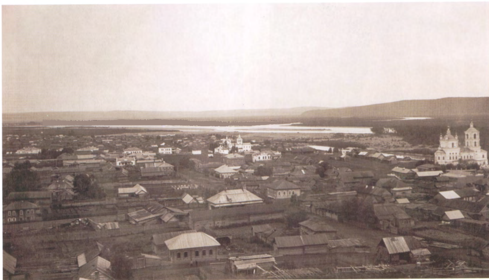
Рис. 4.27. Панорама г. Кузнецка с Крепостной (Вознесенской) горы. Справа – Спасо-Преображенский собор, на заднем плане – Богородице-Одигитриевская церковь. Фото 1910-х гг.