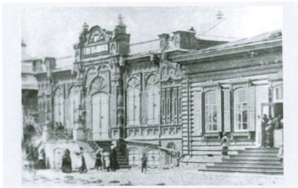
Рис. 4.32. Магазин купца Л.Н. Емельянова, справа видна часть лавки купца С.Е. Шукшина. Фото 1920-х гг.