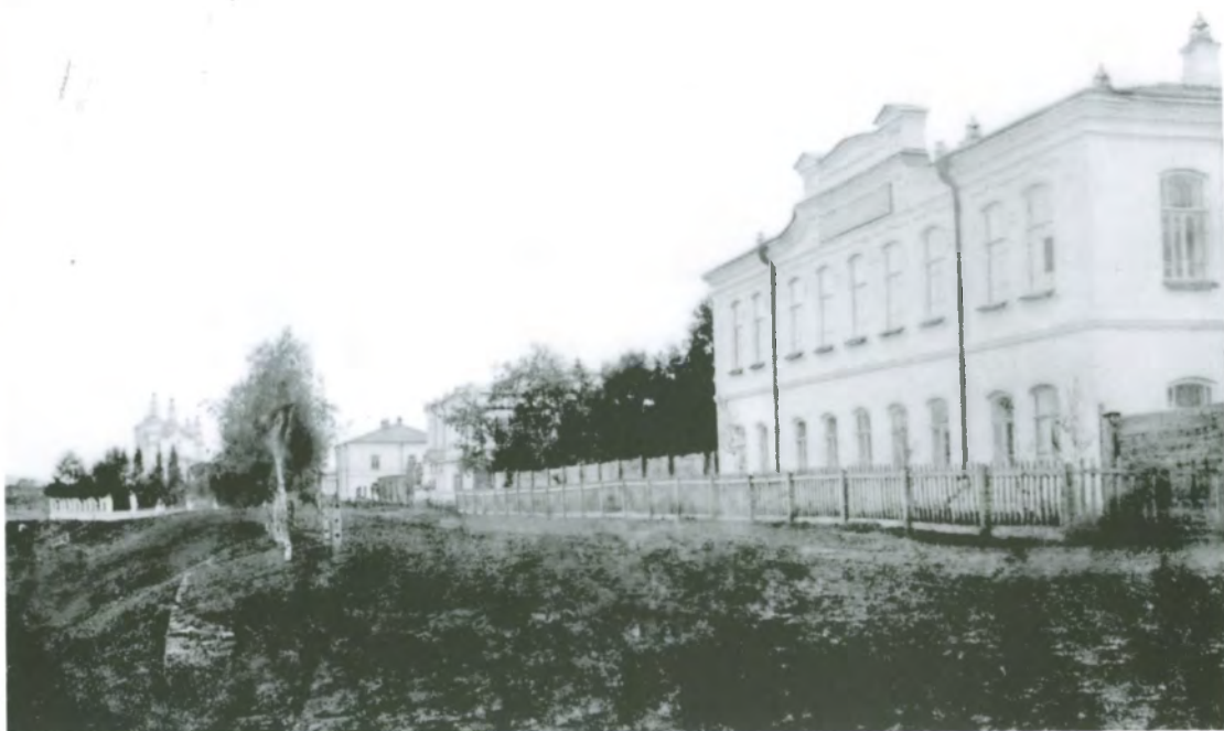
Рис. 4.35. Кузнецкое уездное училище. Построено в 1805 г. Фото начала 1890-х гг.