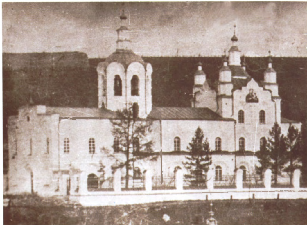
Рис. 4.18. Богородице-Одигитриевская церковь. Фото начала XX в.