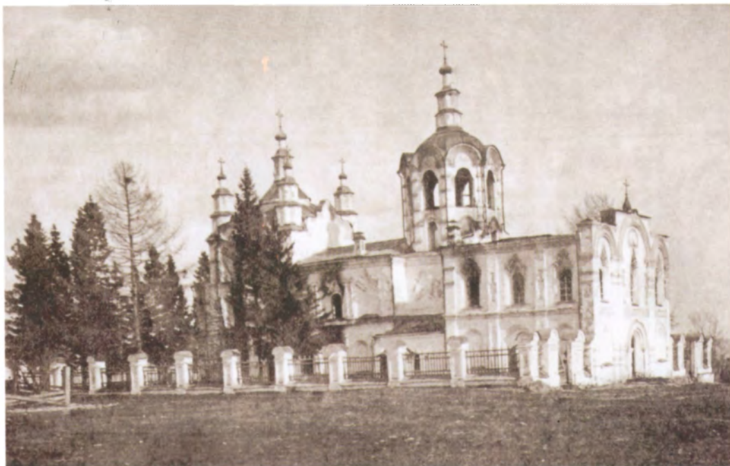
Рис. 4.17. Богородице-Одигитриевская церковь. Фото 1920-х гг.