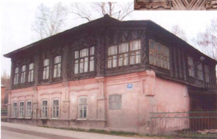
Рис. 4.38. Бывший жилой дом купца А.Е. Фонарева по ул. Водопадной. Фрагмент и общий вид. Фото В.П. Бойко, 2009 г.