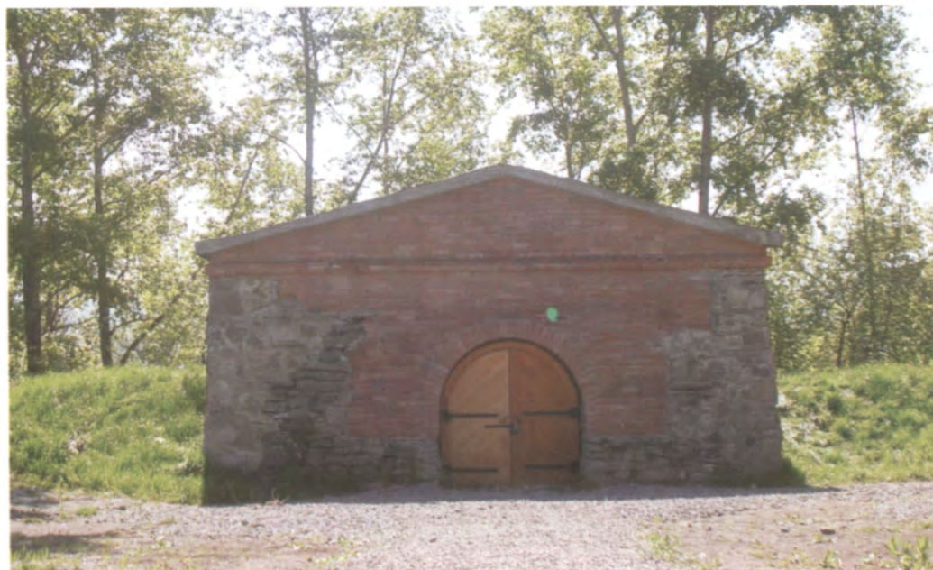
Рис. 4.12. Сортия Кузнецкой крепости. 2009 г.