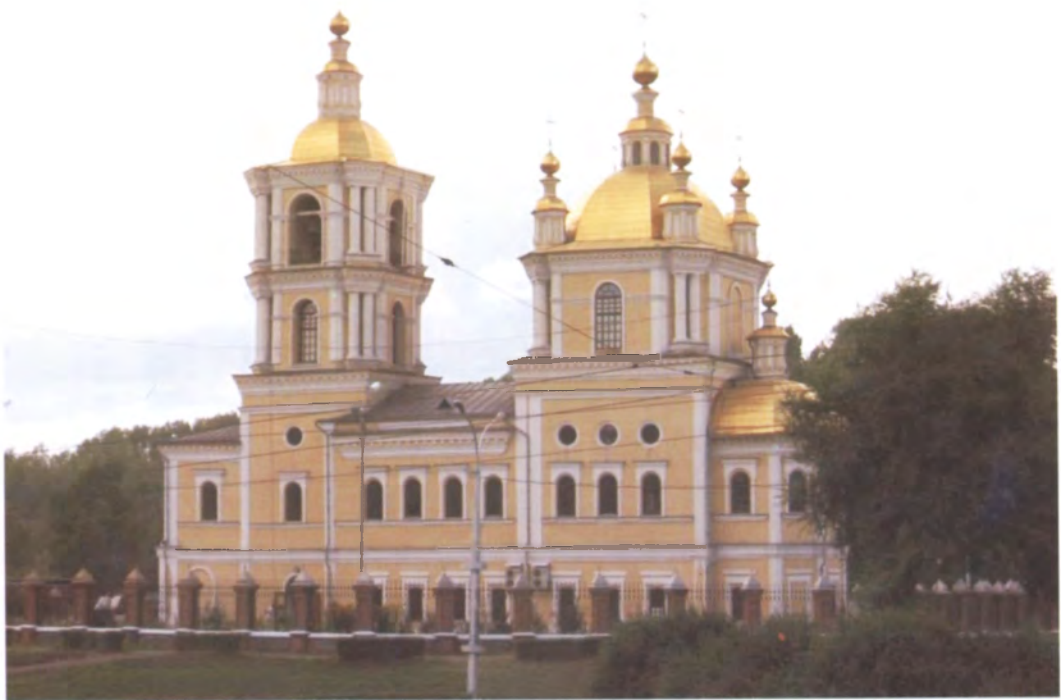
Рис. 4.26. Спасо-Преображенский собор. Фото О.В. Богдановой, 2009 г.