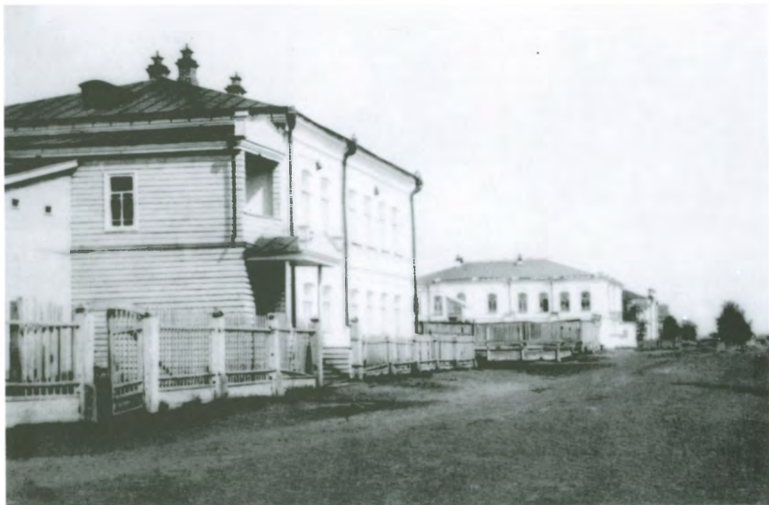
Рис. 4.33. Улица Нагорная. На переднем плане Кузнецкое приходское училище. Фото начала 1890-х гг.