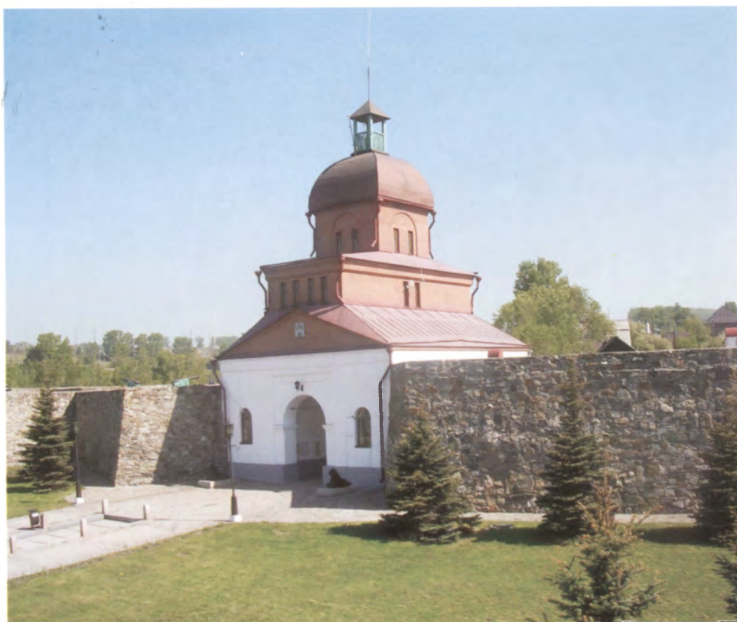
Рис. 4.11. Крепостные ворота. Фото О.В. Богдановой, 2009 г.