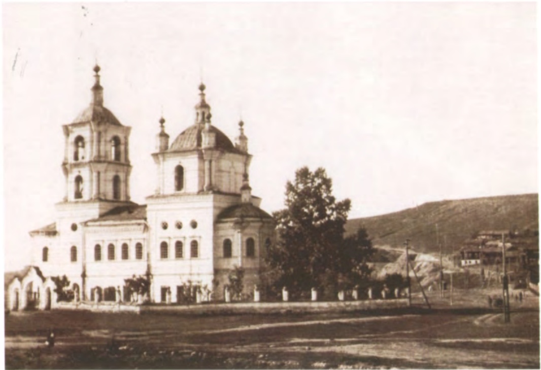
Рис. 4.25. Спасо-Преображенский собор. Фото 1930-х гг.