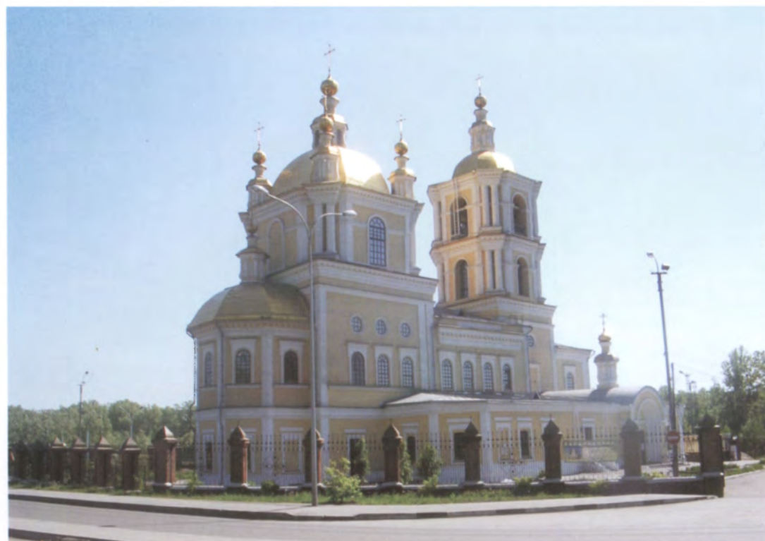
Рис. 4.24. Спасо-Преображенский собор на Советской площади (бывшей Базарной). Фото О.В. Богдановой, 2009 г.