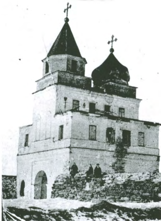
Рис. 4.7. Надвратная Ильинская церковь. Фото 1934 г.