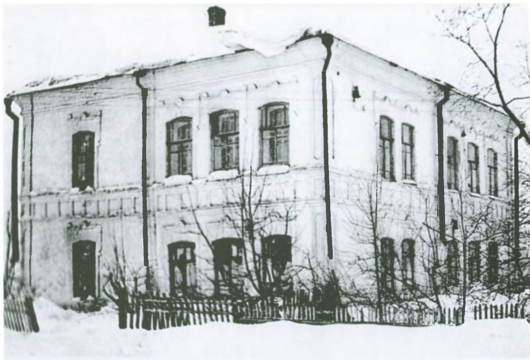
Рис. 4.34. Здание Кузнецкого приходского училища. Фото 1930-х гг.