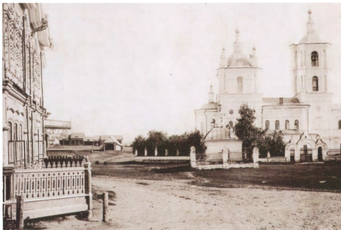
Рис. 4.23. Вид на Базарную площадь. Фото начала XX в.