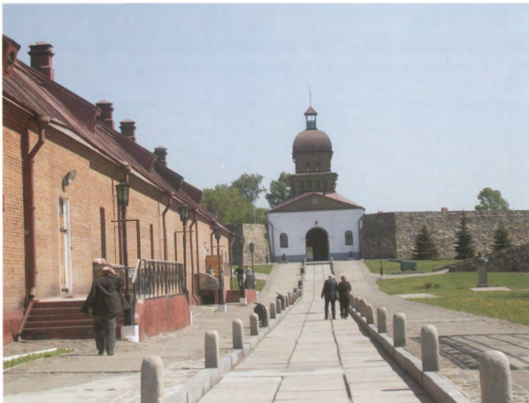
Рис. 4.13. На территории комплекса Кузнецкой крепости. Фото О.В. Богдановой, 2009 г.