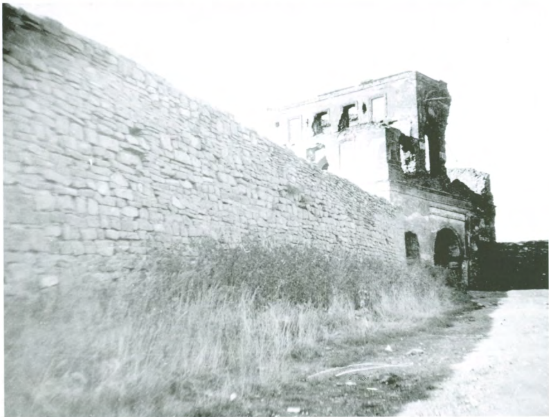
Рис. 4.6. Вид надвратной Ильинской церкви и крепостных ворот. Фото 1930-х гг. и конца XX в.