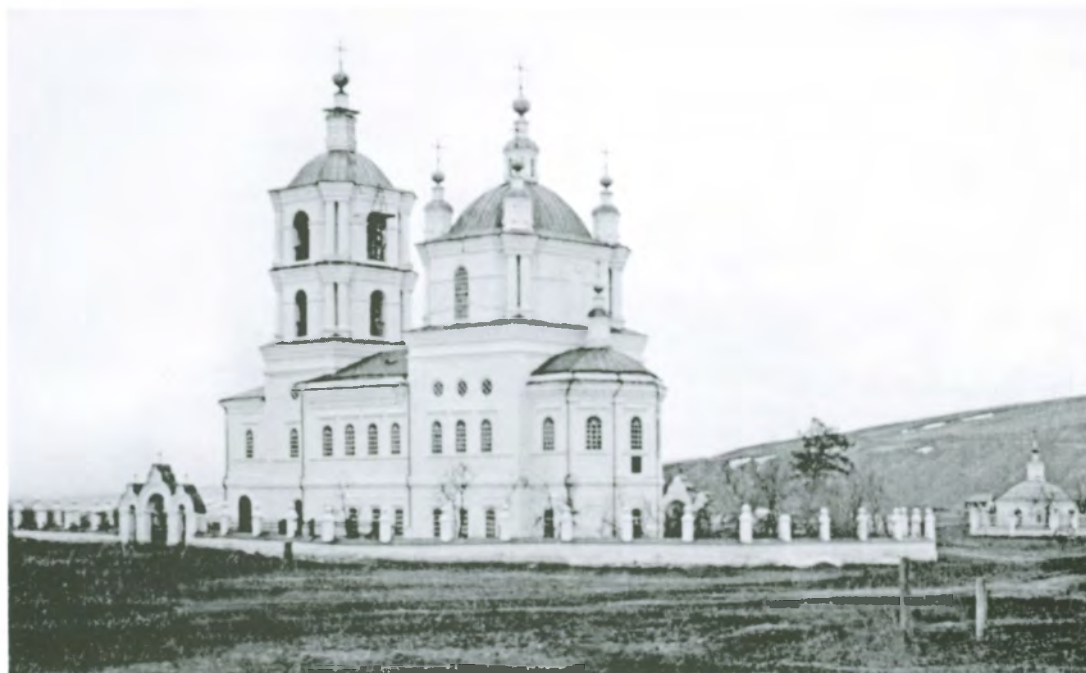
Рис. 4.22. Спасо-Преображенский собор и Иверская часовня, которую построил на свои средства купец Шукшин. Фото 1920-х гг.