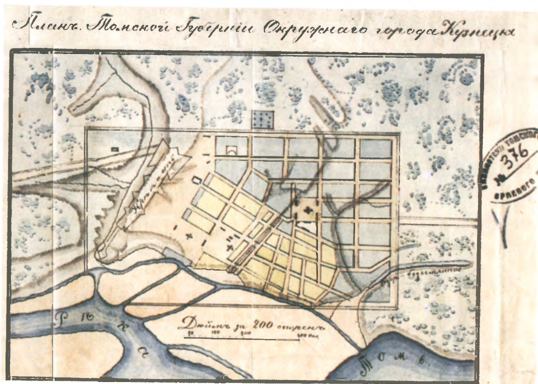
Рис. 4.2. «План Томской губернии окружного города Кузнецка», около 1840-х гг. (?).