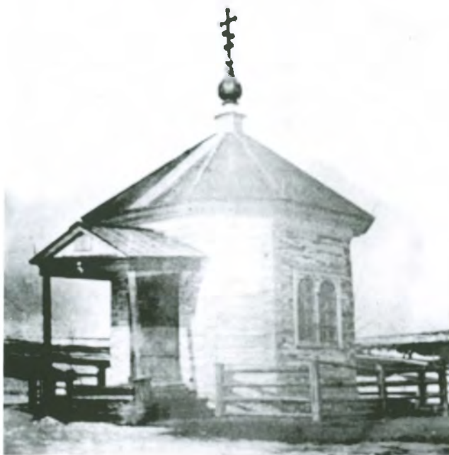
Рис. 4.8. Вознесенская часовня Кузнецкой крепости. Фото 1914 г.