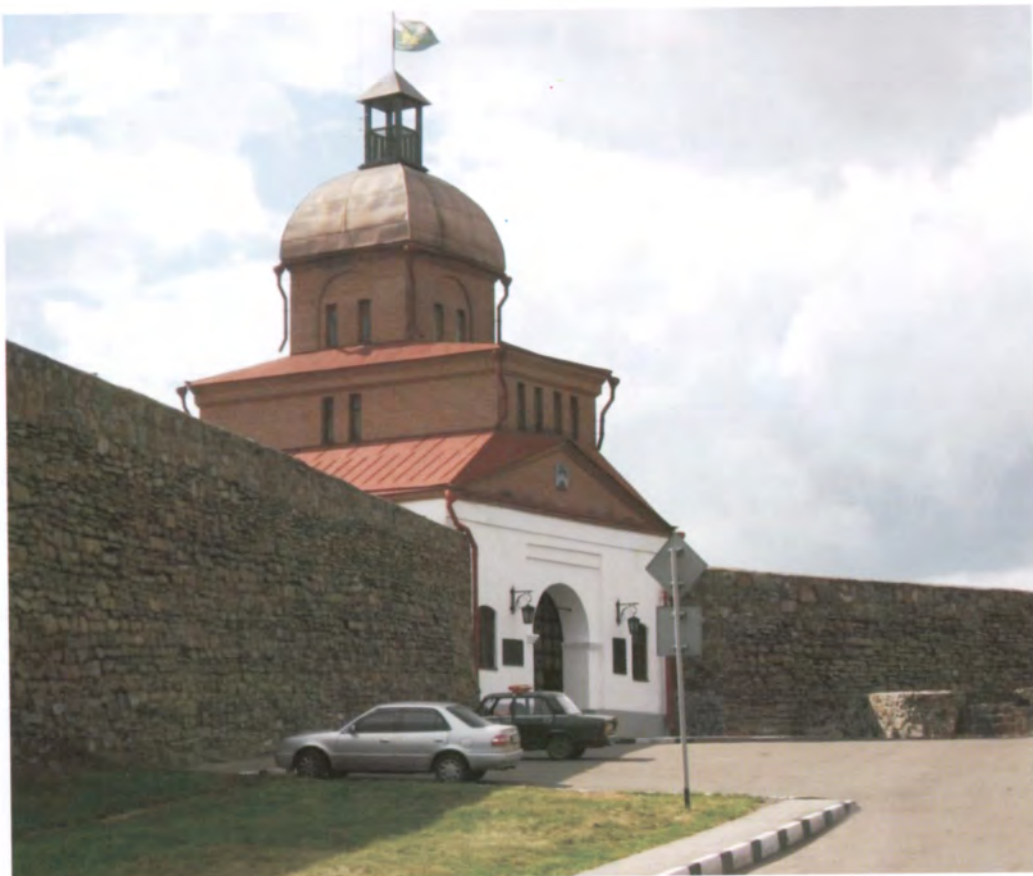
Рис. 4.9. Восстановленные крепостные ворота. Фото О.В. Богдановой, 2009 г.