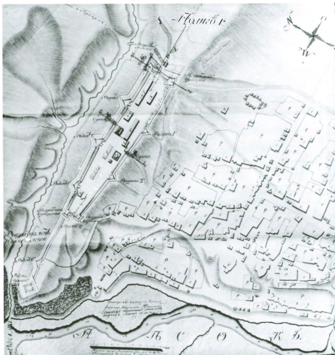
Рис. 4.3. Генеральный план Кузнецкой крепости, 1810 г.