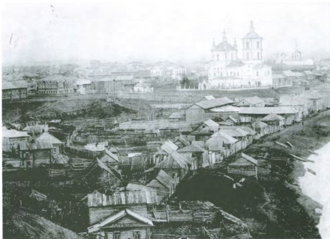
Рис. 4.21. Панорама г. Кузнецка. Вид на Подкамень. Фото начала XX в.