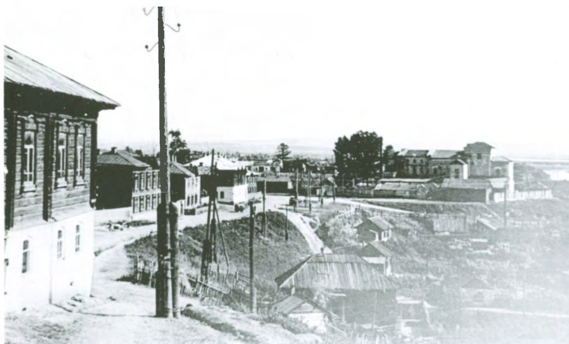
Рис. 4.20. Водопадная улица. Справа – бывший Преображенский храм. Фото 1950-х гг.