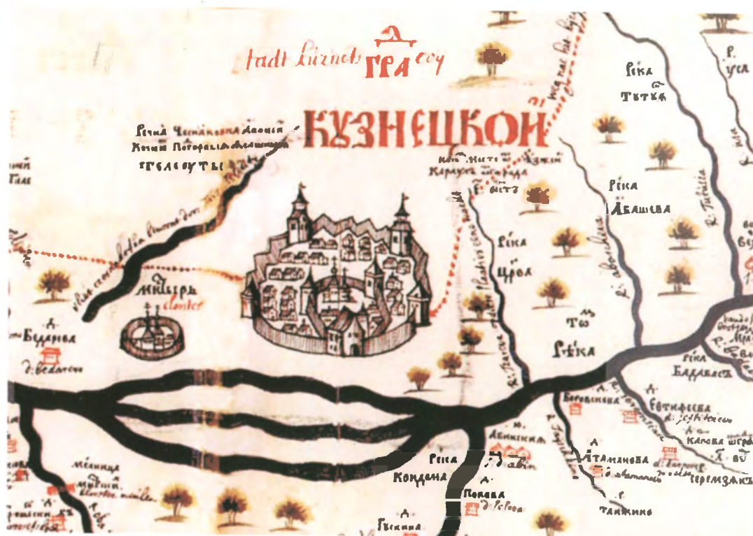
Рис. 4.1. «Град Кузнецкой». Изображение Кузнецкой крепости из «Атласа Сибири» С.У. Ремезова, 1701 г.