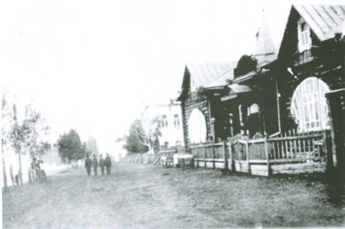
Рис. 4.36. Народный дом имени А.С. Пушкина. Фото 1917 г.