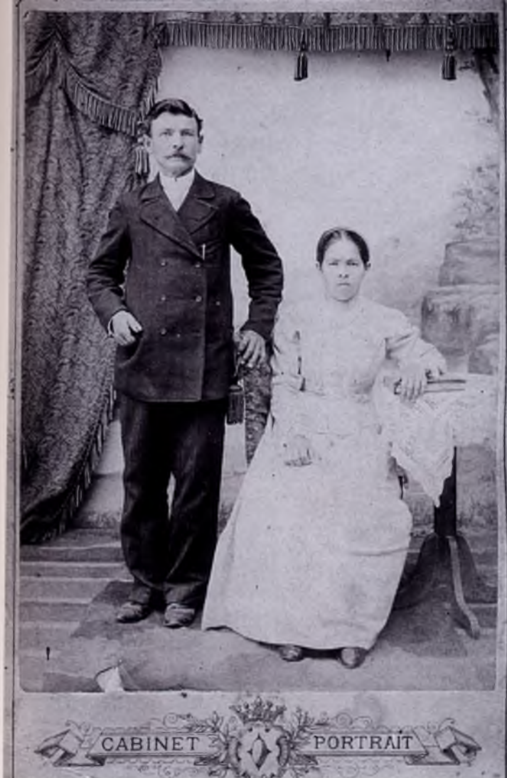
Фотосалон Т.П. Новосёлова. Кузнецк, 1901. Кузнецкие мещане супруги Шукшины