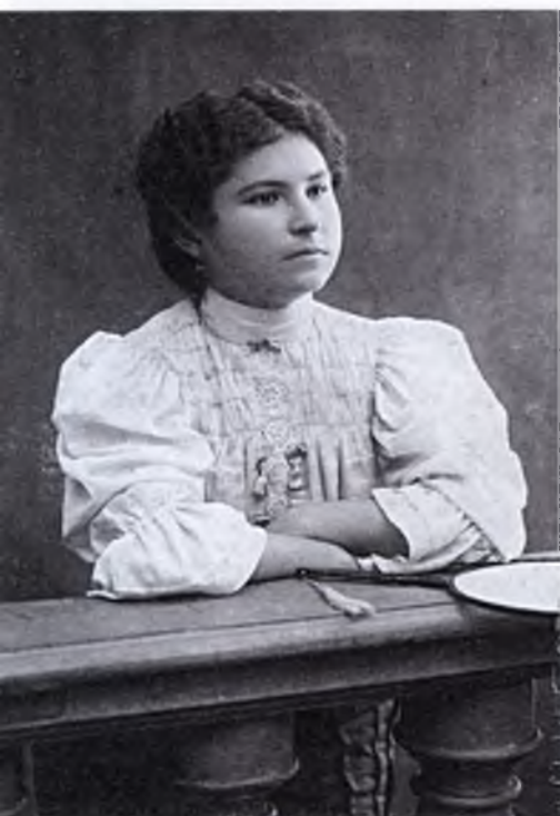
Фотограф Варвара Дмитриевна Бессонова

В период 1917-1919 годов в воспоминаниях кузнецчан всплывает фамилия и