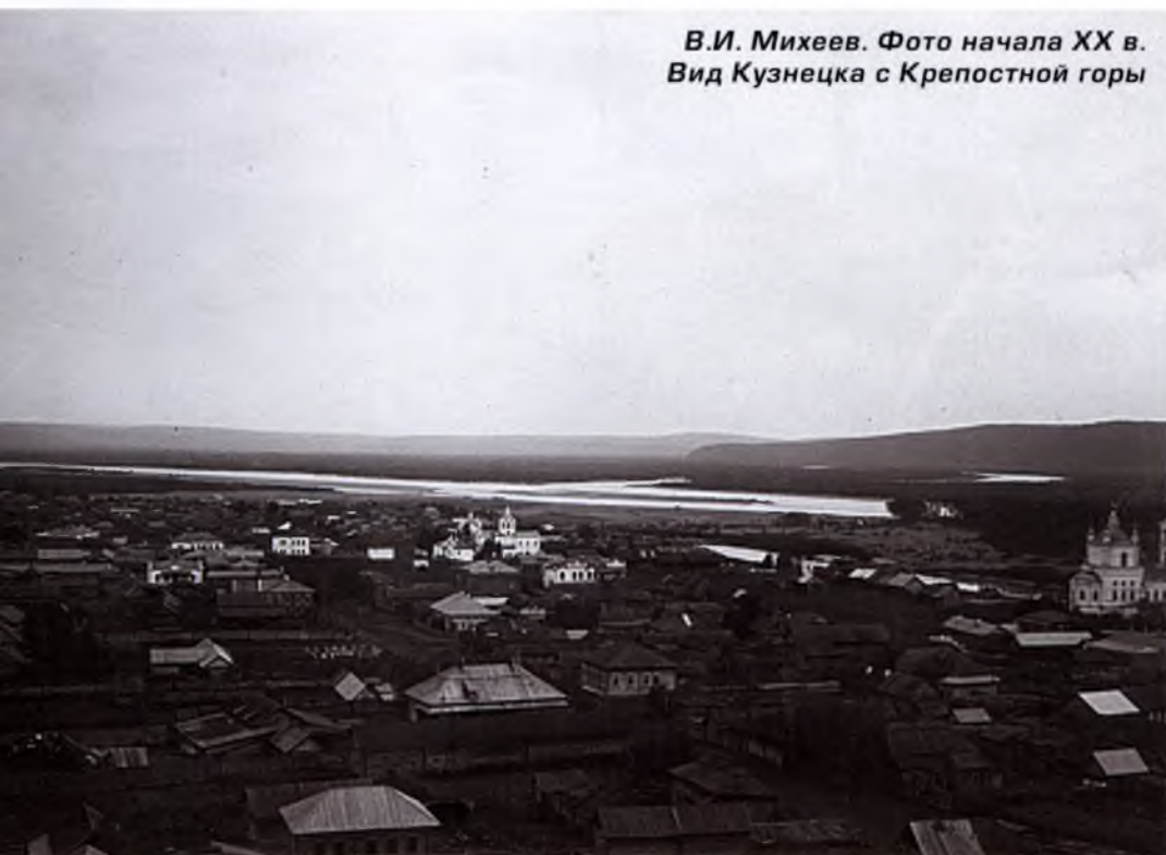
В.И. Михеев. Фото начала XX в. Вид Кузнецка с Крепостной горы