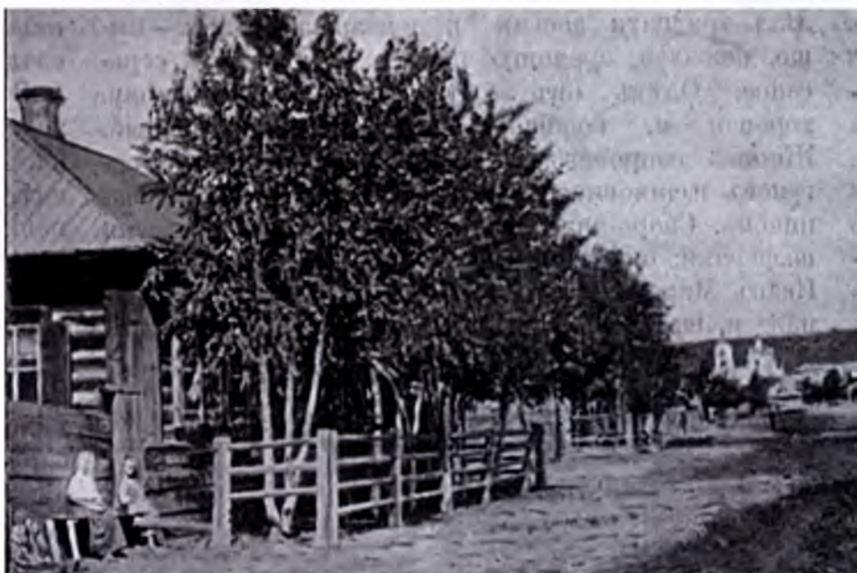
В.И. Михеев. Дом Достоевского. Фото опубликовано в газете «Сибирская жизнь» в 1904 г.