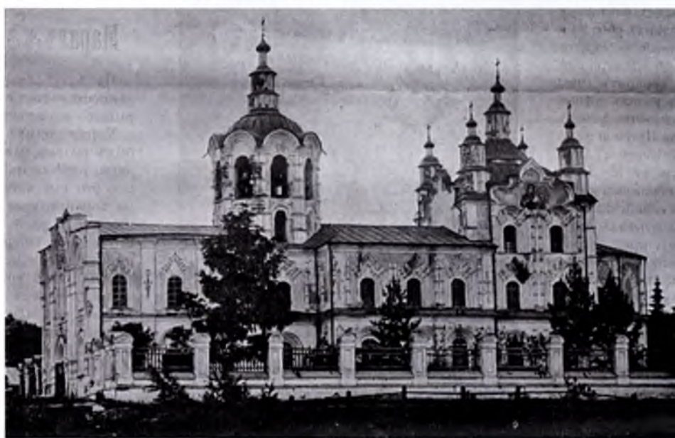
В.И. Михеев. Одигитриевская церковь.