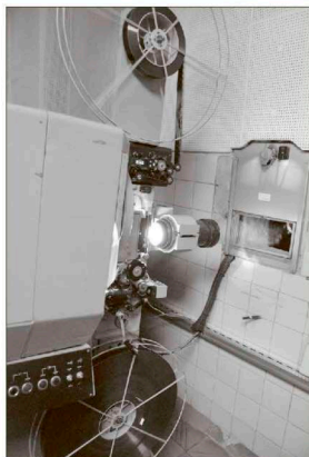
Так выглядели киноустановки с пленочными бобинами...