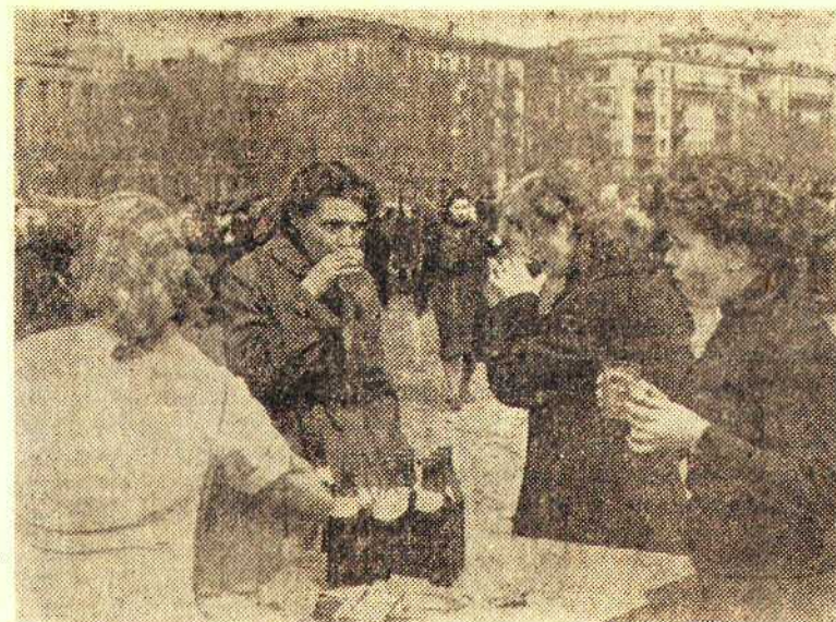
На снимке: у передвижного буфета во время воскресника.

Уже день кончался, а на пустыре все еще то там, то здесь работали люди. Примечательно,