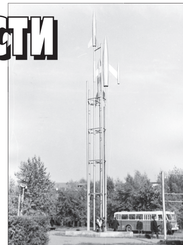
Это обелиск в честь покорителей космоса, ныне отсутствующий

Совершенно необходимо сказать и о площади Космонавтов. К слову, немногие знают, что такая существует. Она располагается на пересечении проспектов Строителей и Металлургов напротив здания бывших городских касс (старожилы его хорошо знают).