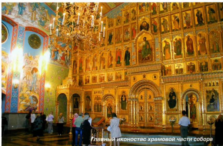
Главный иконостас храмовой части собора