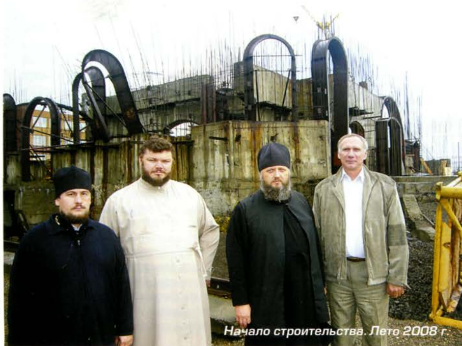
Начало строительства. Лето 2008 г.

В канун Дня шахтера в Новокузнецке открыли и освятили храм Рождества Христова – областной мемориал погибшим горнякам. В мероприятии приняли участие губернатор А.Г. Тулеев и митрополит Аристарх. Как отметил губернатор, особенность главного праздника Кузбасса в том, что он всегда с горчинкой, со слезами на глазах, потому что в этот день не только говорят о достижениях угольщиков, но и вспоминают, какой ценой достаются людям тепло и свет. Об истории строительства храма нам рассказал Владимир Родионович Микрюков, генеральный директор СК «Новокузнецк», осуществлявшей строительство храма.