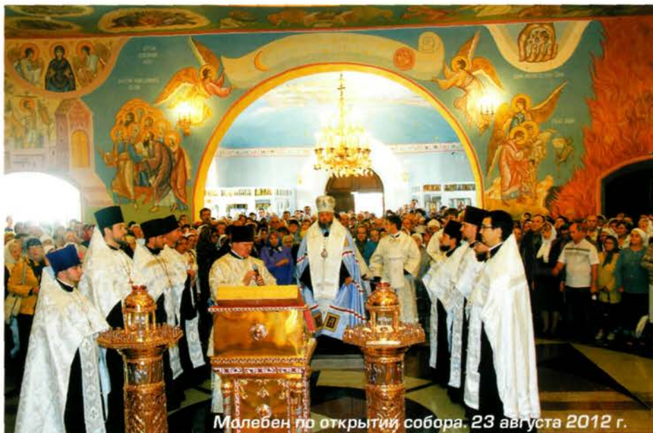
Малёбен по открытии собора. 23 августа 2012 г.

Записала Ирина Казанцева.