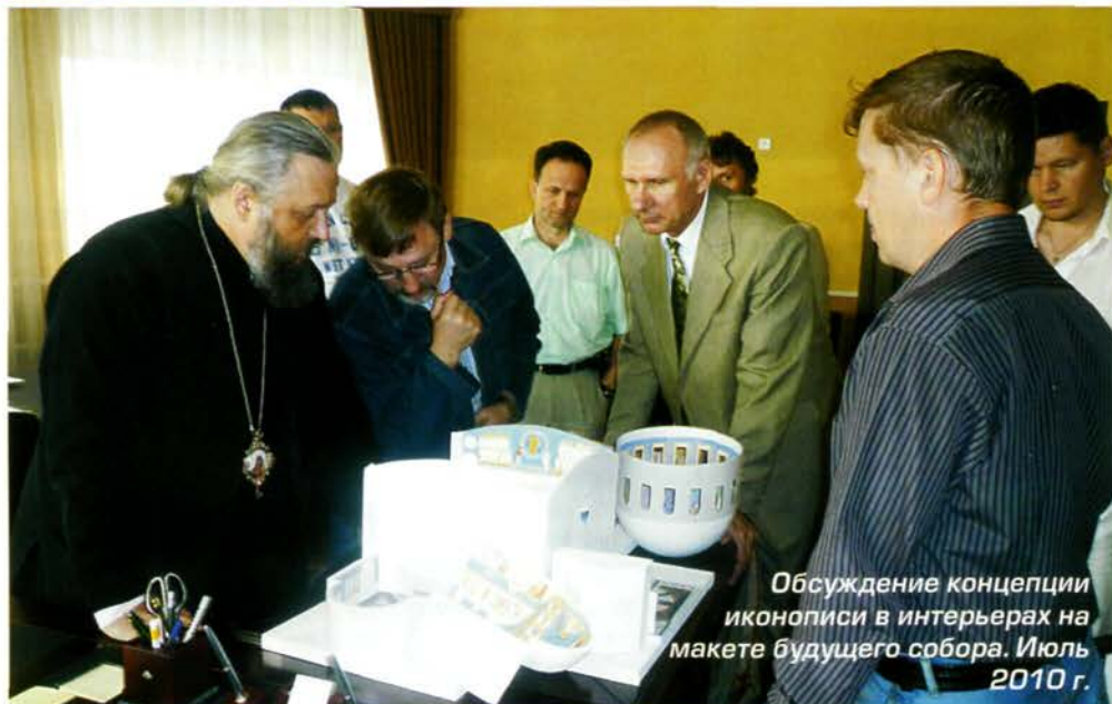
Обсуждение концепции иконописи в интерьерах на макете будущего собора. Июль 2010 г.

Губернатор принял решение поднять архивы и выяснить, когда в них были отмечены первые печальные события на шахтах Кузбасса. Оказалось, что первые записи о погибших шахтерах датированы 1920-м годом. Когда подсчитали общее