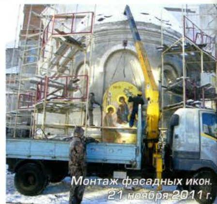
Монтаж фасадных икон. 21 ноября 2011 г.

В мае того же года началась роспись храма. В силу того, что храм посвящен памяти погибших шахтеров Кузбасса, на стенах появились росписи с изображением иконы «Покров Пресвятой Богородицы над Землей Кузнецкой» (этот образ был написан в 2007 году иконописцем из Новокузнецка Леонидом Ключниковым), а также великомученицы Варвары, которая в православной традиции почитается как покровительница