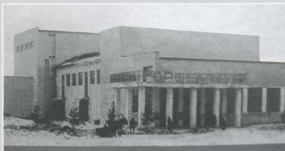
▲ Фото 1930-х гг. из фондов НКМ