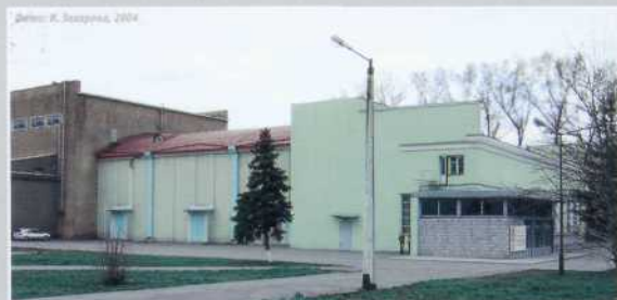
▲ Северо-восточный фасад