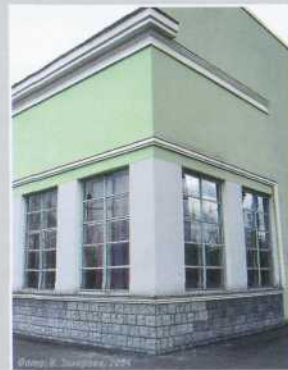
Фото: И. Захаров, 2004