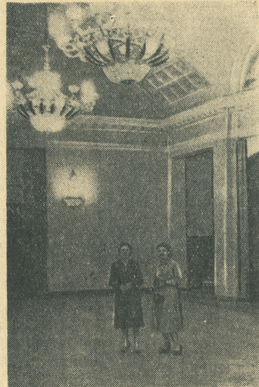
НА СНИМКАХ: сверху слева — общий вид дворца, справа — фойе, внизу — в ложе театрального зала.

И ЭТОТ день настал. Распахнулись двери парадного входа, что ведет в центральную часть огромного здания Дворца культуры алюминщиков. На торжество пришли электрики и анодчики СТАЗа, строители треста «Кузнецжилстрой» и монтажники субподразделных управлений, представители ферросплавного завода и ТЭЦ.