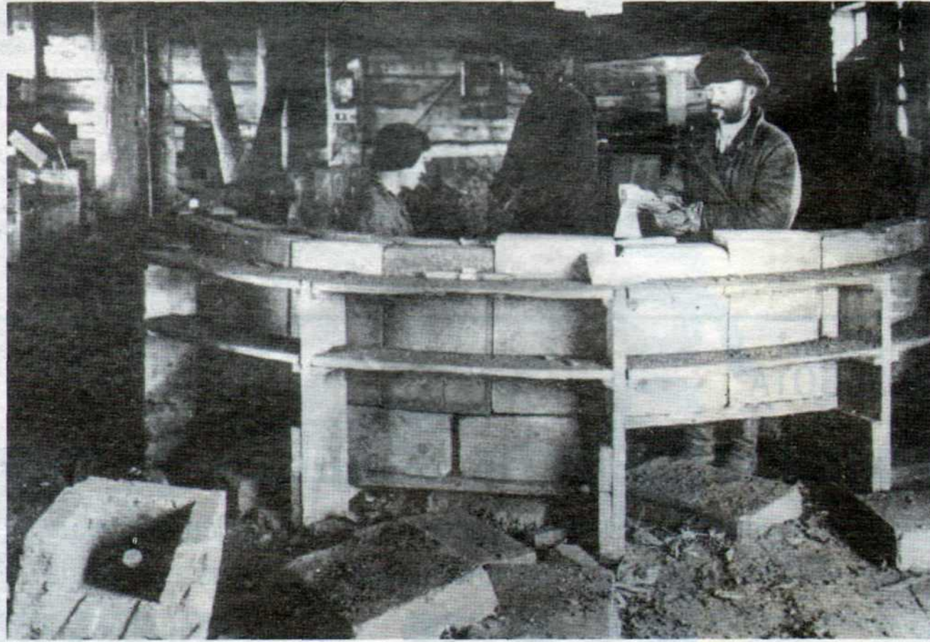
Вот так на электролизерах тех лет устанавливались бортовые блоки

Металлоконструкций катастрофически не хватало, поэтому электролизеры устанавливались с овальными катодными кожухами из листовой стали. Это позволило сэкономить тысячи тонн стального проката.