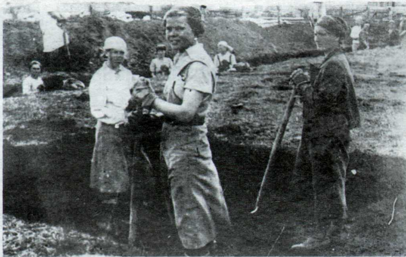
Большинство работ на стройке выполнялось вручную