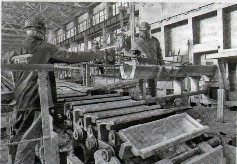
Идет юбилейная плавка