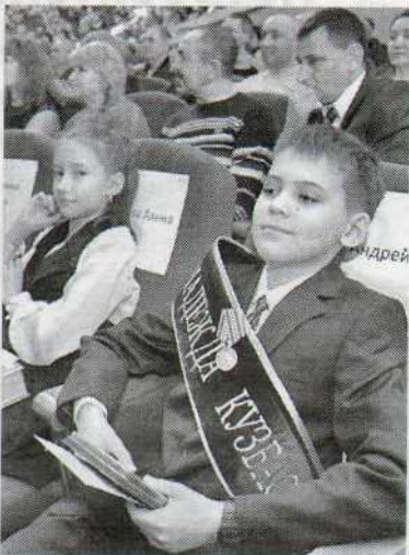
Дети алюминщиков — будущее и надежда Кузбасса

В юбилей принято подводить итоги. НкАЗ не стал исключением. Тем более что последние 10 лет