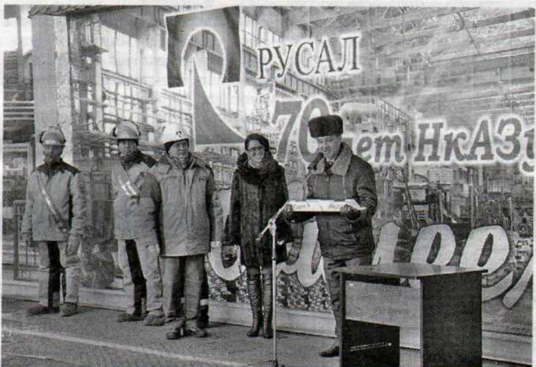
Юбилейный слиток готов!

В декабре 2012 года на НкАЗ-2 завершился проект создания системы замкнутого водооборота, который позволяет собирать и очищать промливневые стоки до уровня технической воды и использовать ее для нужд производства. А сбросы в реку Кульяновку сейчас полностью исключены.