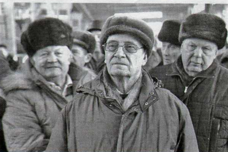
На юбилейной плавке присутствовали и ветераны завода

из своих 70-ти завод проработал в составе РУСАЛа.