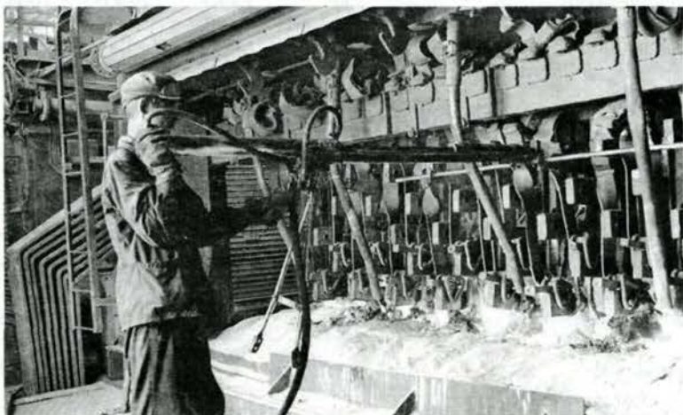
В 50-е использовались такие машинки по забивке штырей в тело анода сжатым воздухом

Коренная реконструкция корпусов стала возможной значи-