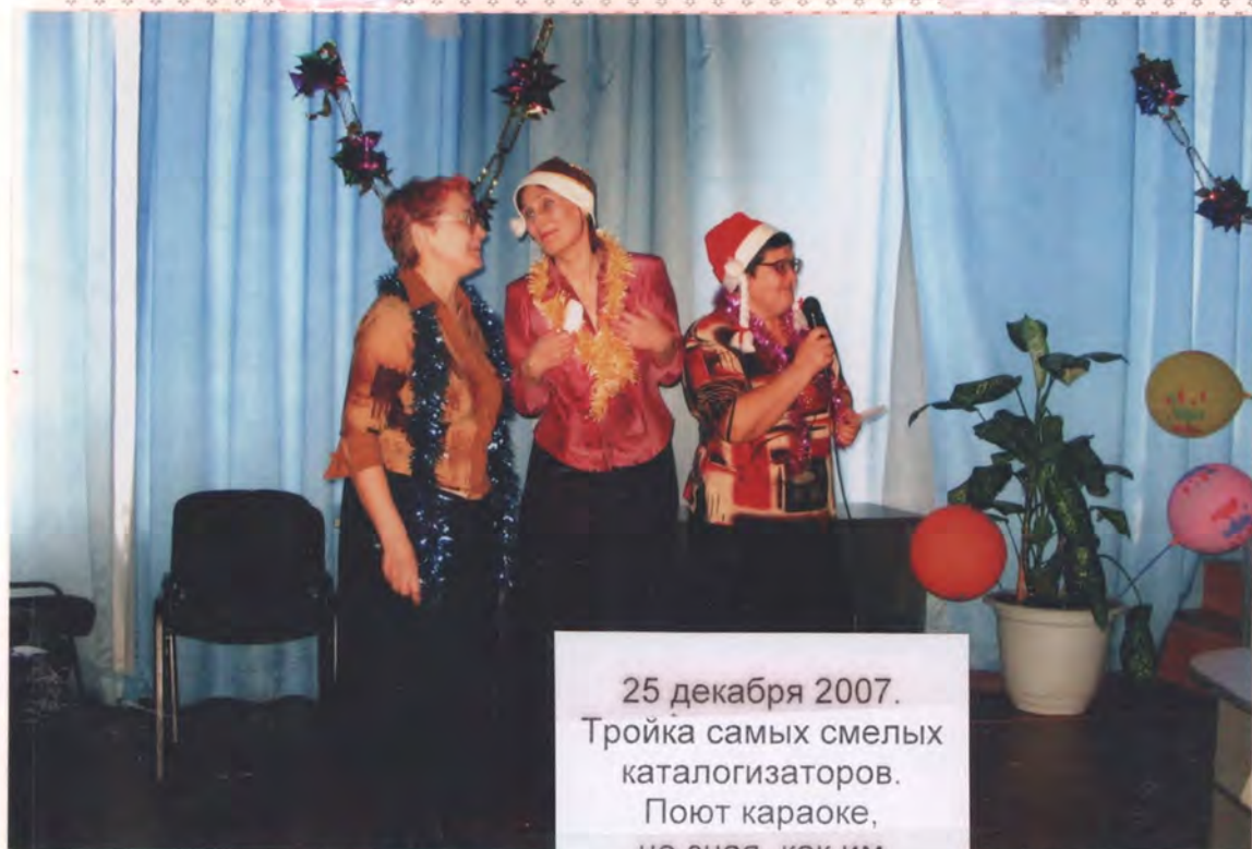
25 декабря 2007. Тройка самых смелых каталогизаторов. Поют караоке, не зная, как им пользоваться