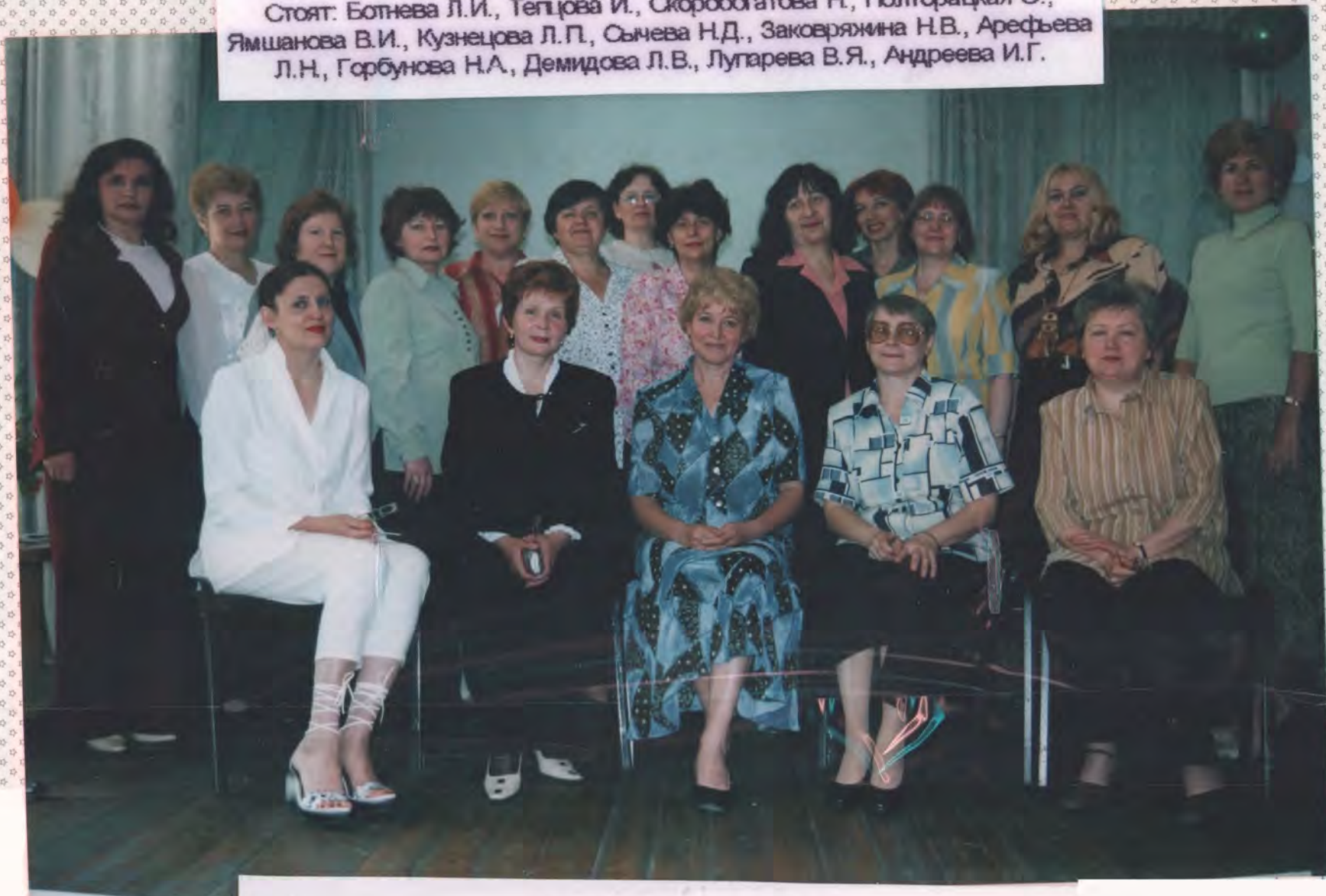
75 лет библиотеке, 2004 г. Пришедшие в ЦГБ в 1970-ые годы