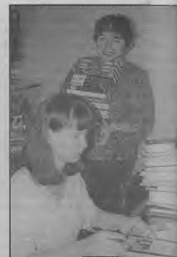
Новое поступление книг

число читателей и пополнить фонды. Среди них есть настоящие литературные сокровища, выделенные в книгохранилище в фонд редкой книги. Насчитывает он 1309 экземпляров, а комплектовался частично за счет закрытых в годы перестройки библиотек. К примеру, образец картографического искусства - атлас Азиатской России 1914 года размером 70x80 см. Это научное издание изначально принадлежало женской гимназии Анцевой, а в книгохранилище «Гоголевки» попало после ликвидации научно-технической библиотеки «Кузбассшхостроя». Много здесь книг начала прошлого века, как, например, том «Бетховен» (биографический этюд с посмертной маской на обложке) 1909 года издания. А самая старинная книга фонда, роман Лафонтен-