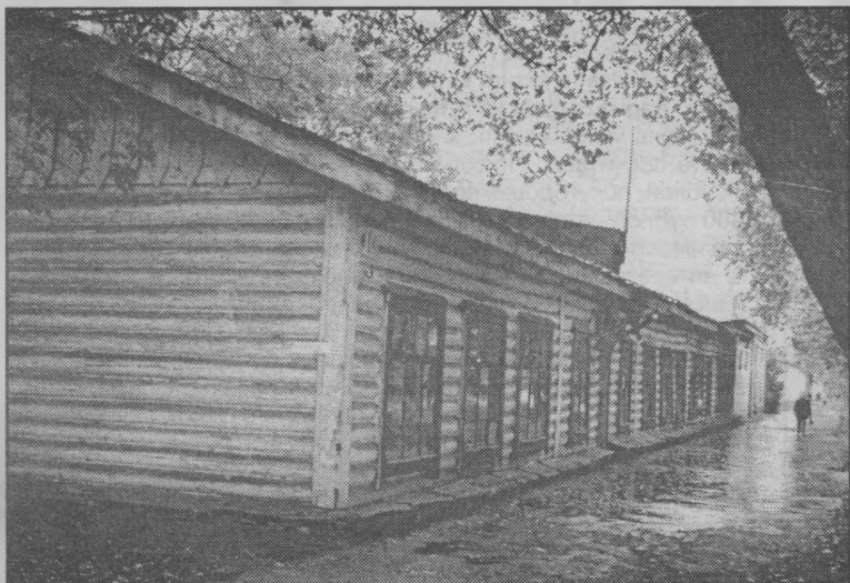
Первое здание библиотеки - барак по ул. Орджоникидзе