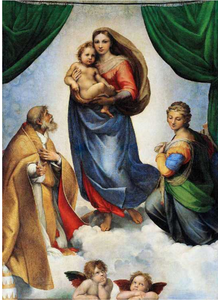
Рафаэль.. Сикстинская Мадонна