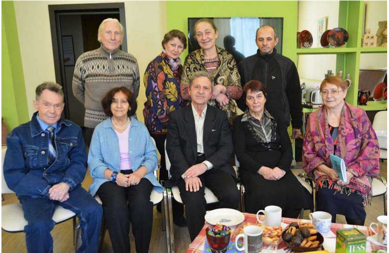
Прощальное чаепитие в библиотеке им. Н.В. Гоголя