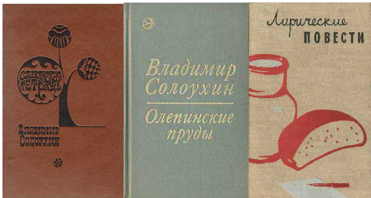
Книги В.А. Солоухина

Позже я приобрёл книгу «Олепинские пруды», где была замечательная повесть «Трава», а в букинистическом магазине купил зачитанную и потрёпанную книжку «Лирические повести», в которой прочитал знаменитые «Владимирские просёлки».