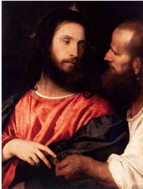
Тициан. Динарий кесаря