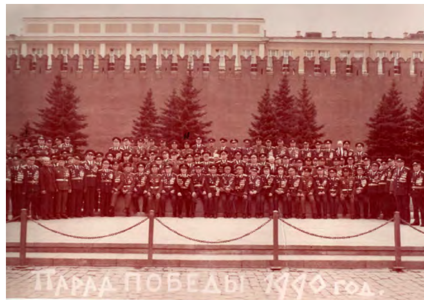
Москва 1990 год Красная площадь

//Кузнецкий рабочий. – 2000. – 24 февраля. – С.2