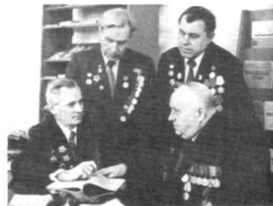
Ветераны 169 Рогашевской строительной дивизии