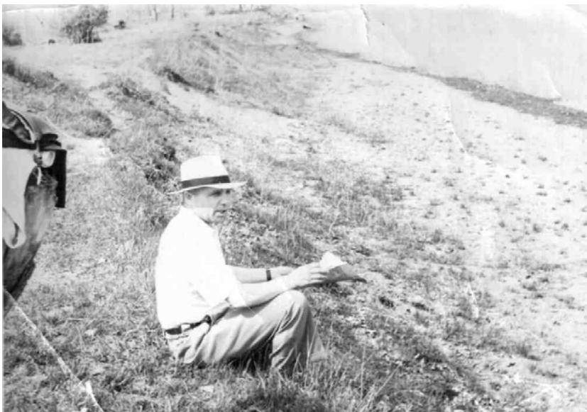
Июнь 1963 года