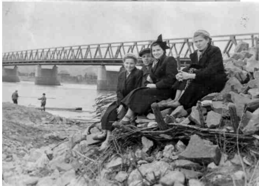
На Байдаевском мосту