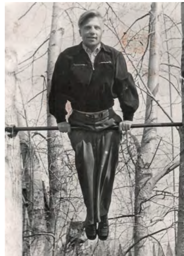
Такая молодость пора...