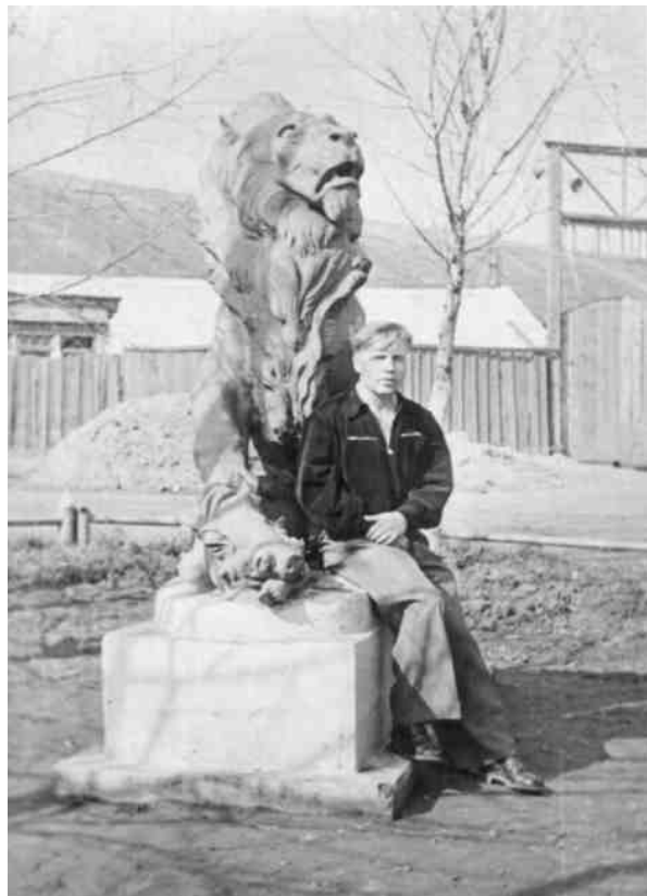
А чем я хуже?