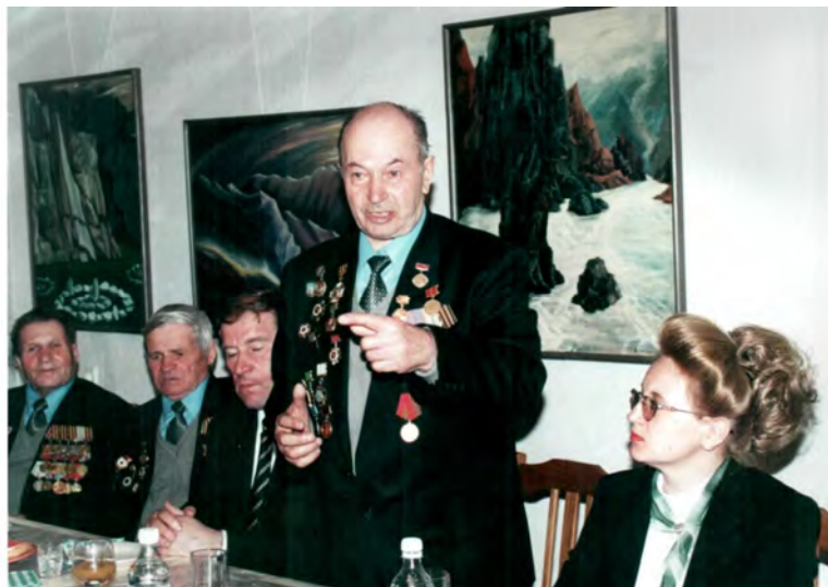
Москва 10 мая 2000 года Полпредство Кемеровской области