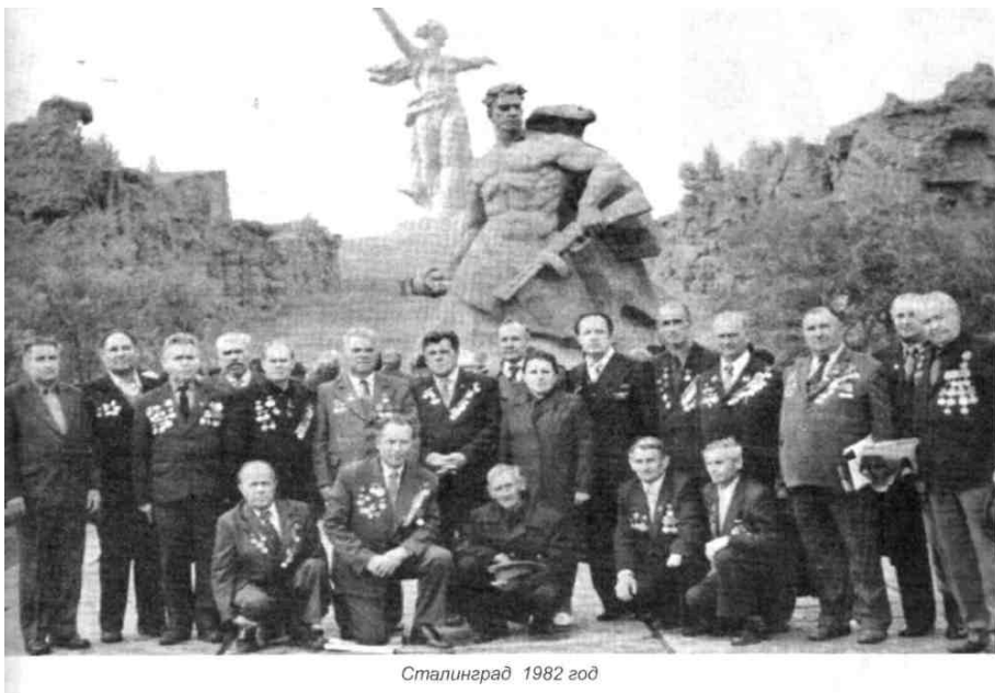
Сталинград 1982 год