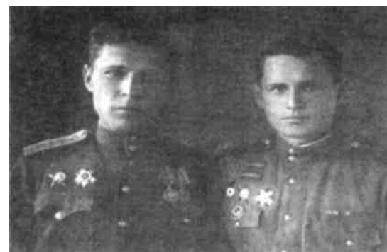
Витебск. 1 октября 1945 год