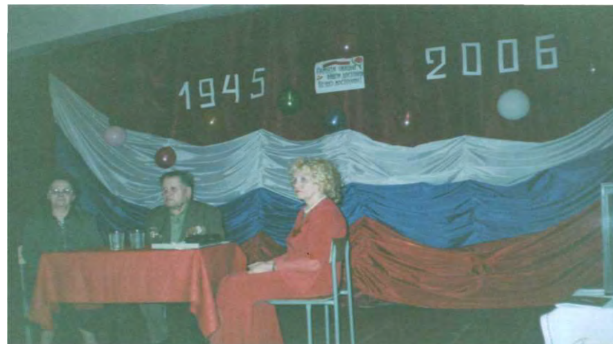
Встреча с учащимися школы №29 6 мая 2006 года