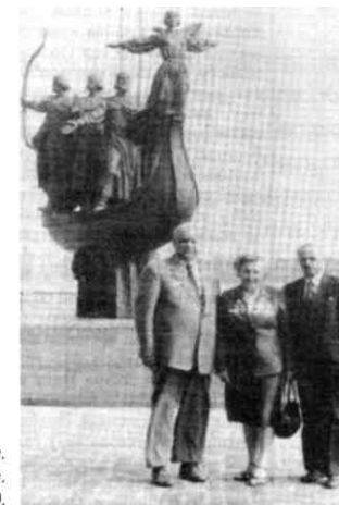
Киев. Берег Днепра. 1987 год.