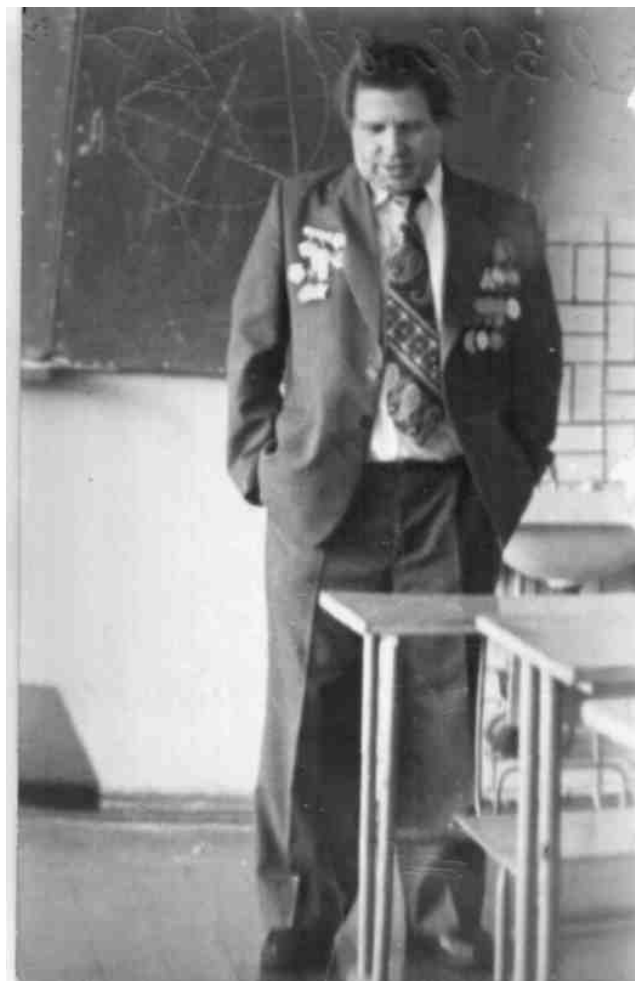
Встреча с учащимися 23 февраля 1982 года