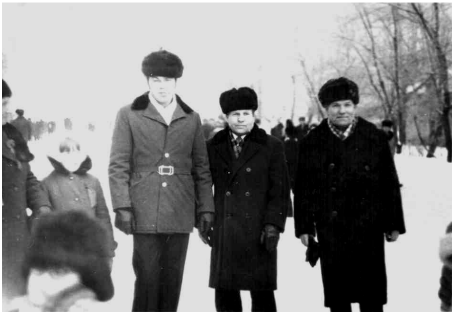
После демонстрации 7 ноября