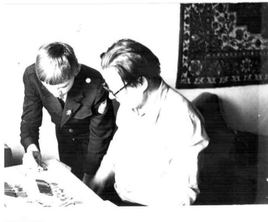
Встреча с учащимися на дому. Рассказ о боевых орденах и медалях