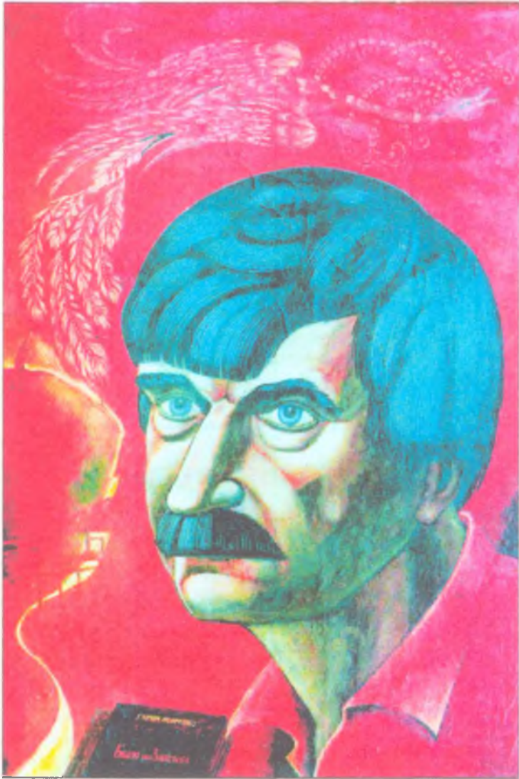
Фомченко А. Ф. Писатель Гарий Немченко 1995 г., холст, темпера, 63x43, в собрании Новокузнецкого литературно-мемориального музея Ф. М. Достоевского