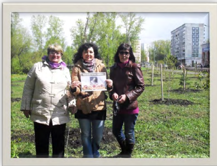
Сотрудники Библиотеки «Куйбышевская»