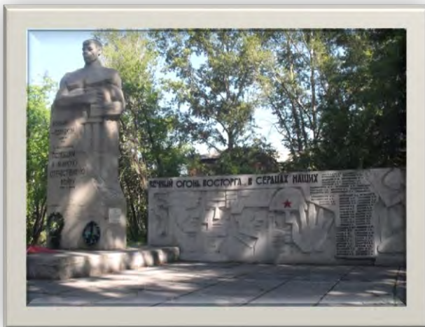
Памятник погибшим горнякам ш. Орджоникидзе