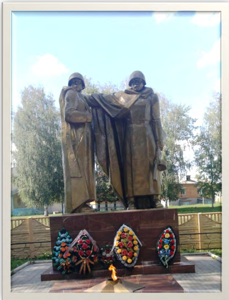
Памятник в с.Бутово