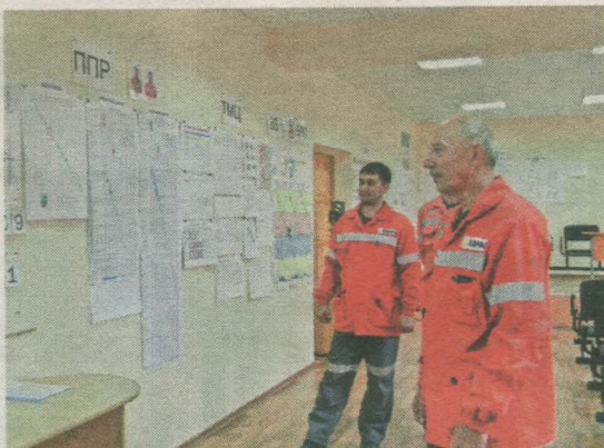
■ В административной ячейке цеха обжига извести