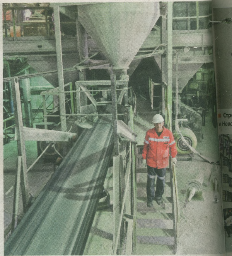
■ Улучшения, внедренные в цехе, исключили аварийные остановки конвейеров