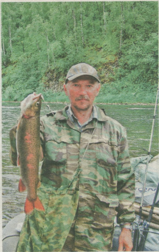
■ «Я знаю, как поймать большую рыбу!»