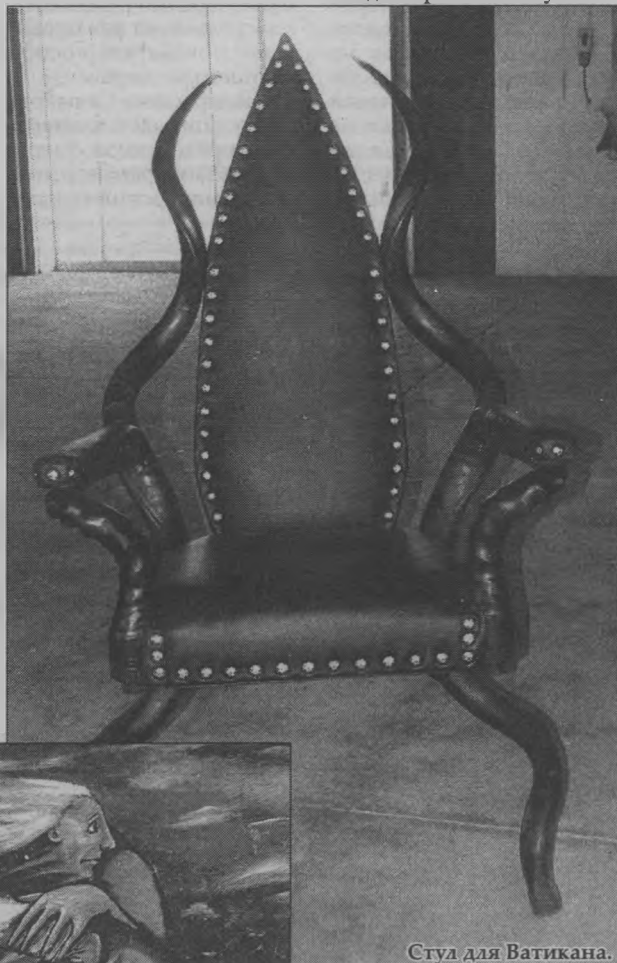
Стул для Ватикана.