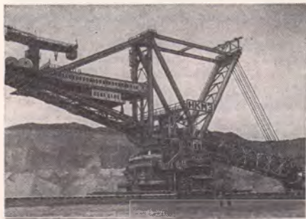
Роторный комплекс производительностью 5000 м 3 грунта в час.

шахтные подъёмные машины с диаметром барабанов от 4 до 9 м, рудоразмольные мельницы с диаметром барабанов от 3,2 до 5,5 м и миксеры ёмкостью 420, 1300 и 2500 т. Несколько видов продукции присвоен Гос. знак качества.