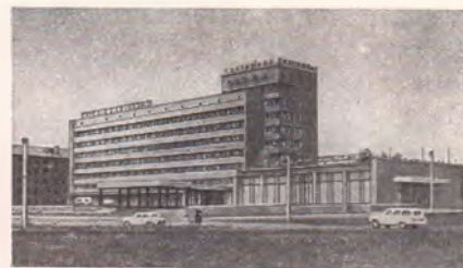
Новокузнецк. Гостиница «Новокузнецкая». 1970. Типовой проект.

НОВОКУЗНЕЦК (б. Кузнецк, в 1931—32 — Новокузнецк, в 1932—61 — Сталинск), город областного подчинения, центр Новокузнецкого района Кемеровской обл. РСФСР.