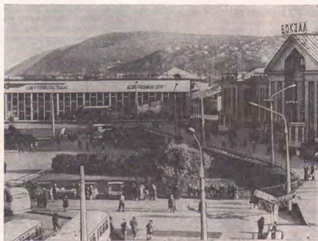
Новокузнецк. Вокзальная площадь.

1617 как укрепленный острог на землях абинцев, к-рых казаки называли кузнецами за умение ковать железо. В 1622 Кузнецк объявлен городом, в 1804 — центр Кузнецкого округа Томской губ. До Окт. революции 1917 Кузнецк был большим торг. и ремесленным центром. Пром. развитие города началось с 1929 в связи со строительством Кузнецкого металлургического комбината , первая очередь