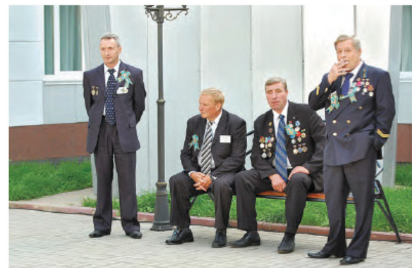
Шахтерская гвардия. 2009 г.

Газета «Кузбасс» старше Кузбасса как региона. Это небольшое преимущество, наверное, и дало нам право в юбилейный для области год оценить и вспомнить, чем и кем знаменит наш край. Мы решили составить своеобразный рейтинг самых известных людей/событий/явлений за эти 70 лет еще и потому, что журналисты в газете работали и работают не в своих кабинетах, а в полях, на заводах, в больницах, школах. Везде, где есть наш читатель. Мы сами вот уже более 90 лет рассказываем кузбассовцам о передовиках производства, артистах, врачах, учителях, доярках. Да просто об обычных людях, живущих рядом с нами. И поверьте, каждый из нас знает таких людей даже не много, а очень много.