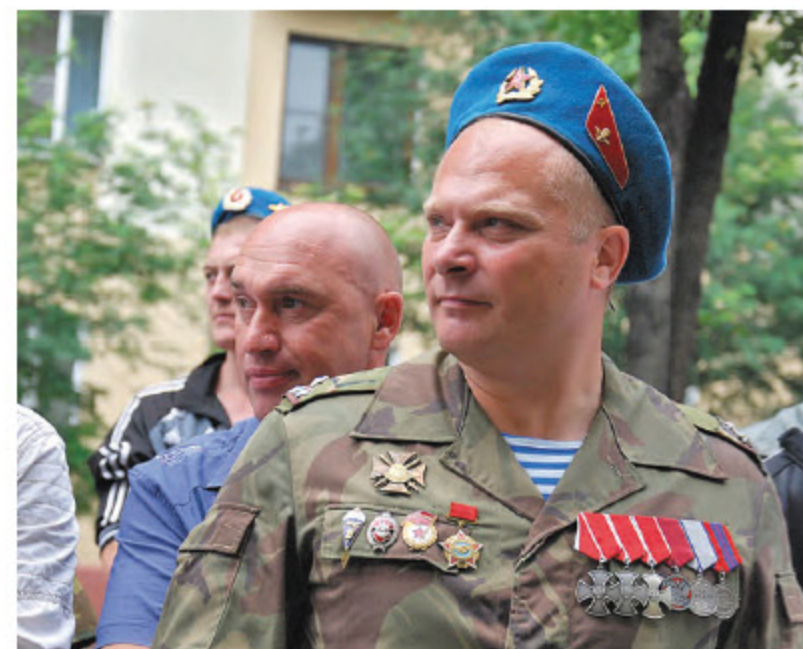
Кавалер ордена Мужества. 2012 г.

только рады, если и в нынешнем году наши читатели будут рассказывать о таких людях. Или наука. В список, например, не попали молодые ученые кузбасских вузов, которые в последние несколько лет совершили настоящие прорывы в области химии, материаловедения, биологии. Их разработки уже применяются на практике. И тут при всем уважении к заслуженным людям не знаешь, когда заниматься наукой было сложнее. В советское время или сегодня... Искусство. Недавно на молодежном форуме «Старт» студенты кузбасских вузов, отвечая на вопрос, кто является лицом