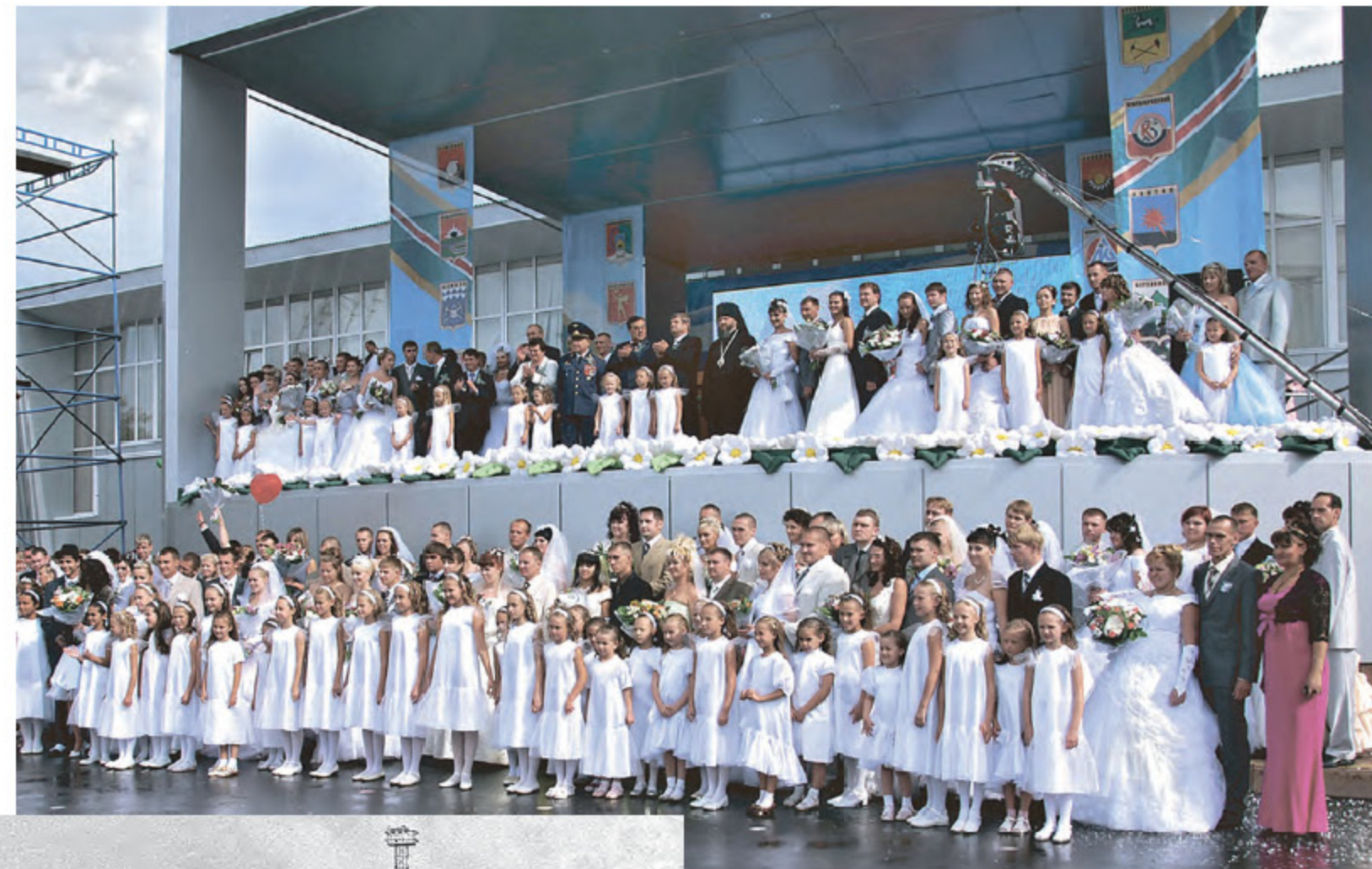
Шахтерские свадьбы. 2009 г.