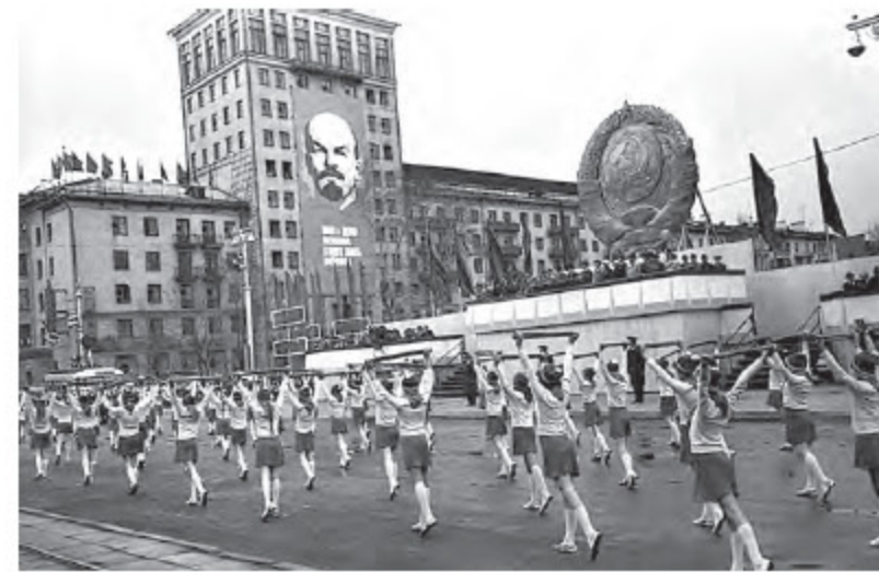
Физкультурники. 1978 г.

области, сказали: Гришковец и команда КВН КузГТУ. И ответы подобного рода в молодежной среде не редки. Не интересуются «серьезным» искусством? Не вежи? Да нет, просто у молодых свои тренды и увлечения! Спросите людей постарше, они к Гришковцу добавят актеров Кемеровского драмтеатра, ставших известными всей стране, – Георгия Буркова, Владимира Самойлова, Михаила Светина. Вспомнят народную артистку СССР Инну Макарову. Перечислят действующих актеров, певцов, скульпторов, художников, которыми богат Кузбасс. И о большинстве из них газета «Кузбасс» рассказывает регулярно. Наконец, производство. Так уж принято. В основном у нас это уголь. И газета очень благодарна нашим экспертам, которые назвали массу людей, построивших промышленный Кузбасс. Нам может, он иногда не очень нравится, потому что всегда хочется небо чище и траву зеленее. Но это нас кормило, кормит и будет кормить. И надо отдать должное, производство в области становится безопасней для окружающей среды. Отдельно обратим ваше внимание на таблицу «Проекты на будущее». Это еще только начинается, зарождается. Но уже вписана в 70-летнюю историю, его не сотрешь. И нам с вами жить и видеть, как развиваются эти проекты. А кому-то из нас – реализовывать свои, может быть, не столь масштабные, но такие важные для конкретного человека. А следовательно, и для области в целом. Коллектив газеты «Кузбасс».