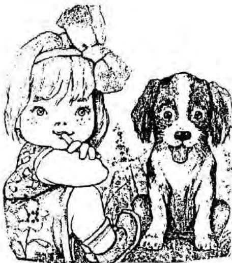
Рисунок Р. Достяна