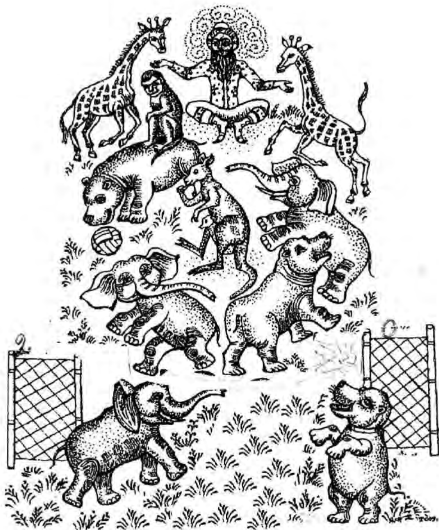
Рисунок Альбертины Фомченко