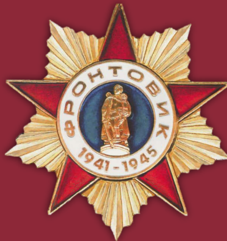
Наградной знак «Фронтовик 1941-1945»