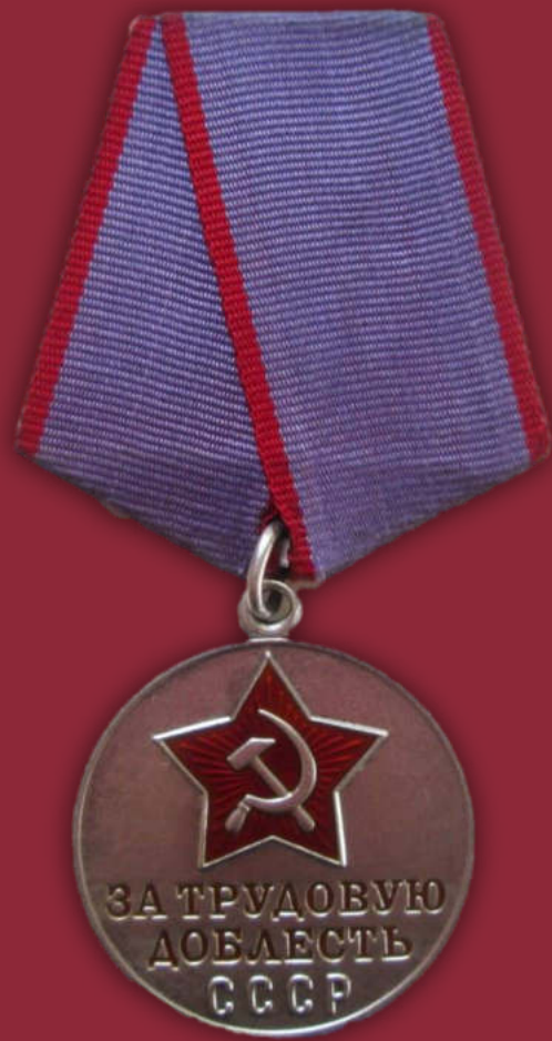
Медаль «За трудовую доблесть»