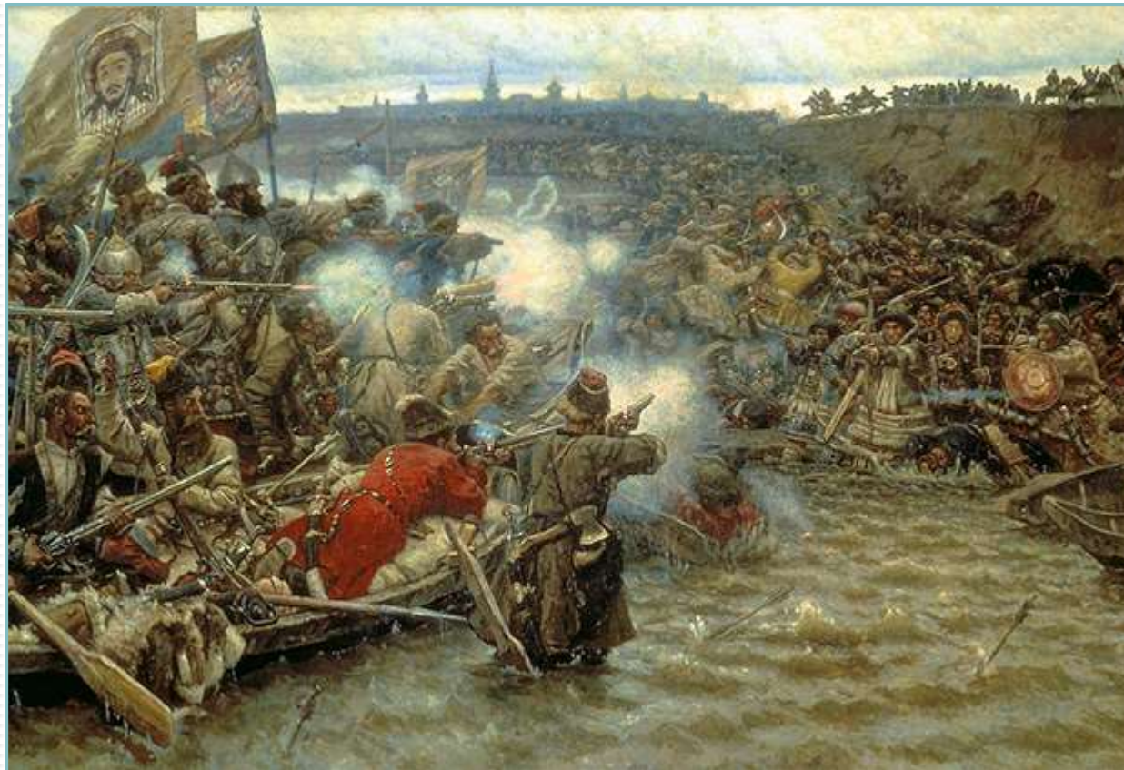
«Присоединение Сибири Ермаком Тимофеевичем» Василий Суриков