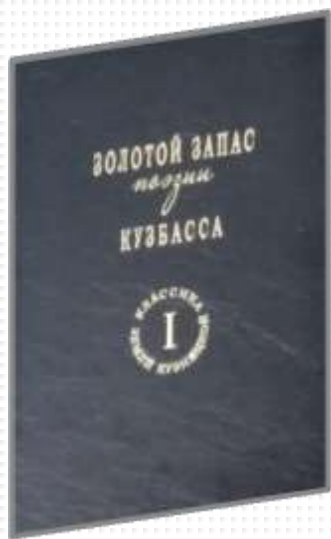
том I Золотой запас поэзии Кузбасса