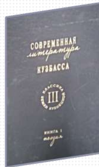
том III Современная литература Кузбасса книги 1, 2