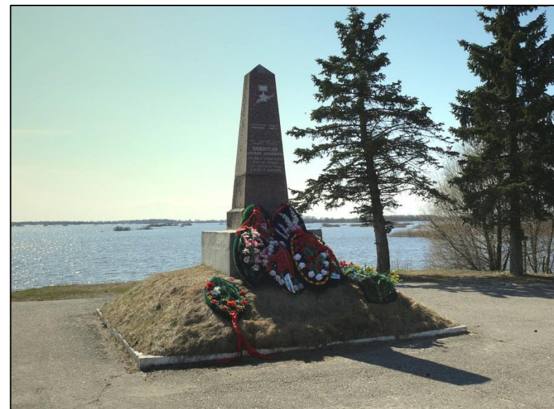
Рис. 5. Памятник А. Панкратову у Синего моста (рядом с Великим Новгородом).

Подвиг Панкратова стал первым подвигом такого рода в истории Великой Отечественной войны.