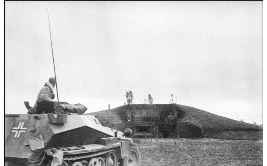
Рис. 1. Дзот времён Великой Отечественной войны. СССР. 1941 год.

ДЗОТ (деревоземляная огневая точка) - полевое оборонительное фортификационное сооружение, построенное из брёвен, досок и грунта.