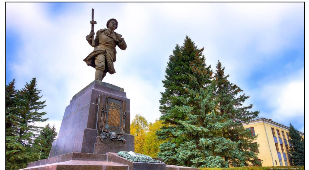
Рис. 3. Надгробный памятник Александру Матросову в г. Великие Луки, открыт 25 июля 1954 г.

Аналогичные подвиги в годы войны совершили более 400 человек .