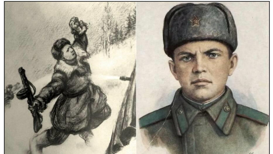
Рис. 2. А. Матросов.

*91-я стрелковая бригада имени И.В. Сталина , воинское формирование вооружённых сил СССР в Великой Отечественной войне. Бригада формировалась на станции Юрга Новосибирской, сейчас Кемеровской области летом 1942 г. В конце сентября 1942 г. отправилась эшелоном в Подмоскovie, где доукомплектовалась. В действующей армии с 06.10.1942 г. по 26.04.1943 г.